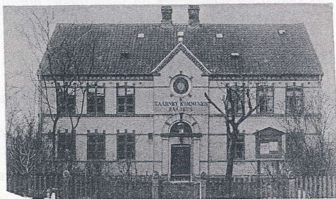
Tårnby Kommune gamle rådhus i Kastruplundgade. Ca. 1920

I 1904 fik socialdemokratiet for første gang sæde i sognerådet og erobrede 3 ud af de 7 pladser her. Forud var gået en intens valgkampagne, ved hjælp af omdelte tryksager, møder, og annoncer i aviserne. Socialdemokraterne ønskede bl.a. at forbedre vejene, skolerne, at oprette et gas-og vandværk og ændre ligningen af kommuneskatten. Disse programpunkter var -i følge Amager Avis- også De Moderates mål.