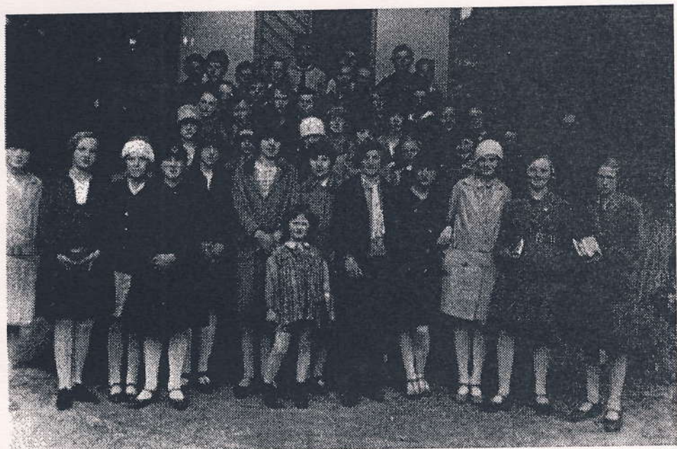
Konfirmandforberedelse i 1930'erne ved Tårnby Kirke.

Der blev tidligere kun holdt konfirmation en gang om året, men efter 1840 blev der også holdt konfirmation om efteråret. Med konfirmationen fulgte en række borgerlige rettigheder, man kunne nu blive gift, få en gård i fæste, blive soldat og være fadder. Skudsmålsbogen blev også udfyldt af præsten ved samme lejlighed. Heri blev karaktererne fra skolen og børnenes kundskaber fra konfirmationen noteret, og bogen fulgte alle tjenestefolk livet igennem. Den fungerede samtidig som en slags anbefalingsbog og flyttebog.