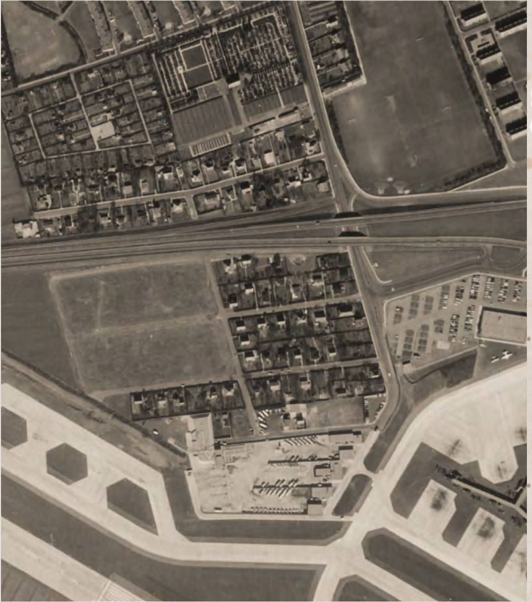
Midt i billedet skær motorvejen igennem grundejerforeningen og over en tredjedel af arealet er eksproprieret. Op til lufthavnen ses benzin-gården og de mange lastbiler. Luftfoto fra 1964.