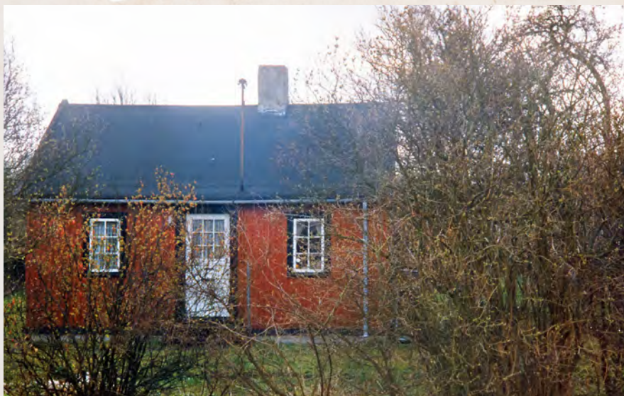
Et sommerhus på Nyhøj Allé der blev eksproprieret i 1993 i forbindelse med anlæggelsen af Øresundsbroen. Fotograf: Viggo Iversen. Foto: Tårnby Stads- og Lokalarkiv, B10452 – beskåret

Grundejerforeningen forsøgte på mange måder at få ændret beslutningen om eksproprieringen af 78 af foreningens parcellhuse. Formanden var eksempelvis inviteret til et møde først i februar 1961 med statsministeren