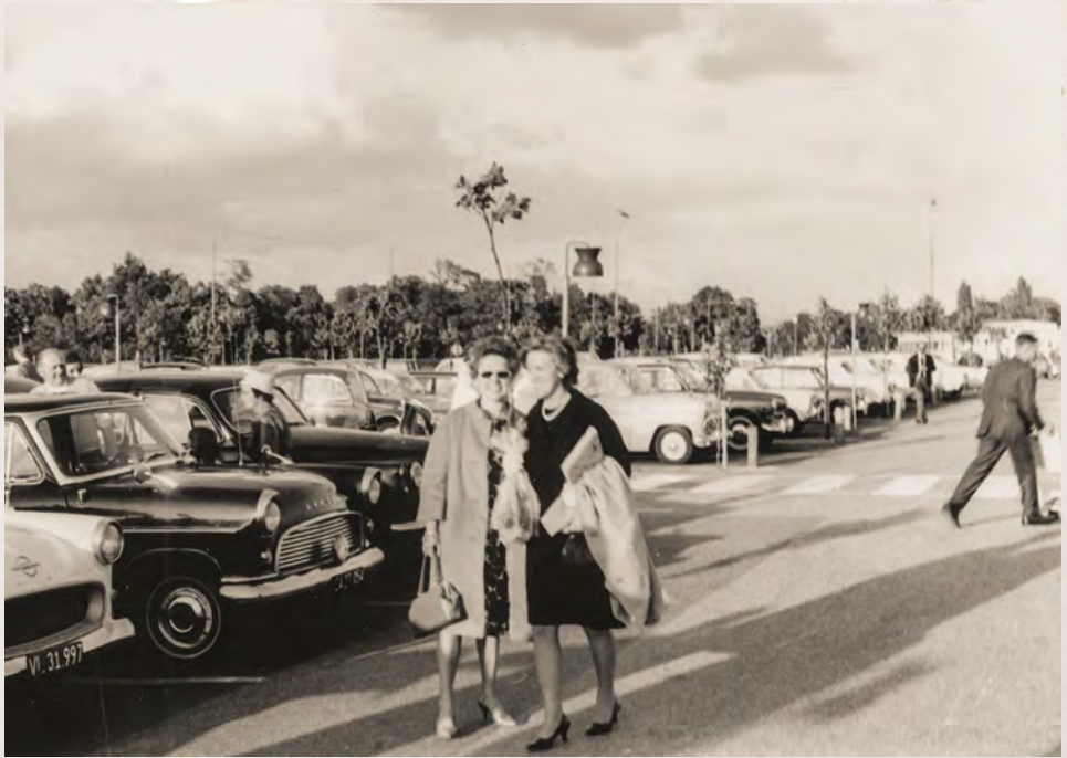
Parkeringspladserne ved Københavns Lufthavn i Kastrup – formentlig er træerne længst væk Kastrup Fremme og resten af træerne afskærmer mellem bebyggelserne og lufthavnen. Fotograferet omkring 1955-1960. - beskåret