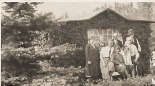
Familien Rasch samlet med venner foran et lidt lille sommerhus til fotografering den 12. maj 1931.

I 1920 var der blevet indført seks dags arbejdsuge med en arbejdsdag på otte timer. For første gang fik Henris far og mange andre lønarbejdere fast fri om søndagen og fri tid på hverdage til at nå andet end at arbejde og hvile.