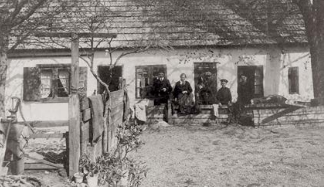
Den tidligere landsbyskole i Maglebylille, som blev bygget 1822, blev brugt til beboelse fra omkring 1837.