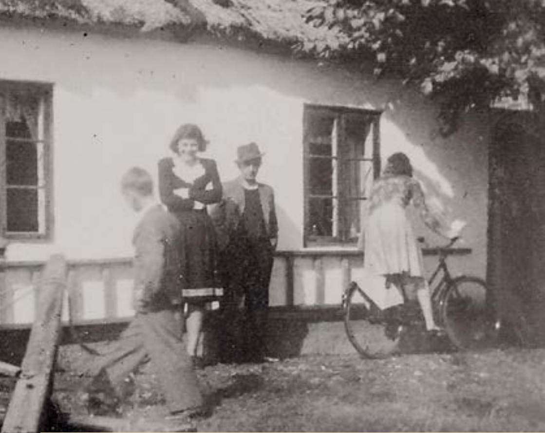
Selvom lufthavnen skulle udvides på Maglebylilles jord, så fortsatte mange gårdejere med at dyrke markerne. Her ses en trædemølle, som hesten trak rundt. Den drev hakkelsesmaskinen i bygningen bagved. Fotograferet i 1946 på en gård i Maglebylille. Foto: Tårnby Stads- og Lokalarbiv, B2832 - Beskåret

I april 1957 blev forpagtningen af skoleloddet opsagt til ophør den 1. april 1958. Af den grund blev der på arealet ikke dyrket grøntsager men korn i 1957, da far mente, at en intensiv behandling af jorden ikke kunne betale sig. Samtidig blev udnyttelsen af arealet hjemme ved gården øget, idet man anskaffede mistbænke, så der kunne dyrkes finere grøntsager, idet man dels selv fremavlede de planter, som skulle udplantes på markerne og bagefter kunne man dyrke meloner.