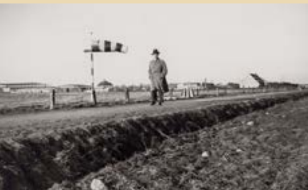
Lufthavnen i 1936, da man kunne gå langs strandkanten på strandvejen. Med tyskernes besættelse af Danmark i 1940 blev lufthavnen udvidet, og området blev utilgængeligt.

var, at hesten på et tidligere tidspunkt havde fået en skade på det ene ben, en omstændighed, som ikke generede den, hvis den blot blev skånet en smule og som intet betød til daglig.