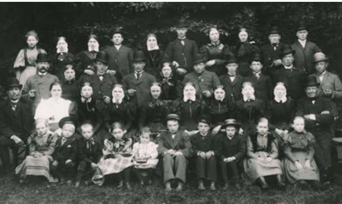
Beboere fra Maglebylille på skovtur omkring 1895 - en social udflugt i det grønne.