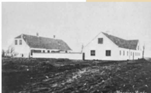
Hansens Minde som gården tog sig ud i 1945 – efter branden havde haft fat i bygningen.

mine forældres lejlighed til at bestå af et vindfang, en gang, køkken og spisekammer, to stuer – spisestuen og den pæne stue, som kun blev brugt ved festlige lejligheder, sove-værelse og barnekammer.