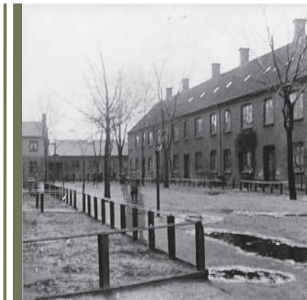
Glasmagerrækkerne i Sals Alle, fotograferet ca. 1910-1915. Bagerst, til venstre i billedet er ”Salen”, glasmagerens forsamlingshus.