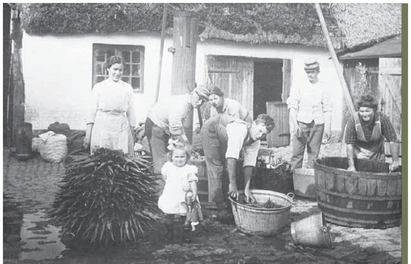
Arbejdet med grøntsager på Strøbyvej 10 lettedes med soldaternes hjælp ca. 1917-1918.

Soldaterne var også et nyttigt supplement i høsten, hvor alle hænder skulle bruges. Særligt ved tærskningen gjorde de gavn, for det gjaldt om at få kornet tærsket i en fart, for man havde kun det dampdrevne tærskværk i kort tid, inden det skulle videre til næste gård.