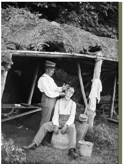
Barbering under feltforhold.

Strandhotellet blev indrettet som ”messe”, hvor soldaterne blev bispist, så kvarterværtene ikke skulle sørge for madlavning. Det var dog ikke med hotelværtens gode vilje, for hotellet kunne jo ikke have almindelige gæster imens. Dragør Kommunalbestyrelse gav