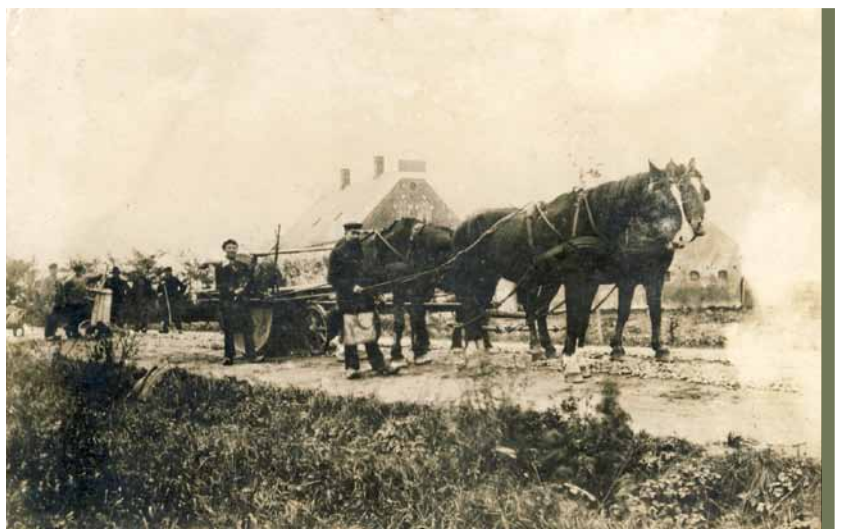
Tømmerupvejen tromles for at forbedre vejen ved Helgeshøj på Tømmerupvej 3. Tromlen trækkes af fire heste. Fotografiet er fra ca. 1910-1916.

skolernes lokaler. Generelt var skolerne velvilligt indstillede, og gymnastiksalene i Tømmerup, Ullerup og Kastrup skoler blev i løbet af 1915 udlånt til indkvartering af soldater. Dog var det et problem, at gymnastikhallen på Tårnby Skole var blevet indrettet til militærhospital, og man rettede derfor henvendelse til Indenrigsministeriet for at få det fjernet. Soldaterne benyttede også andre faciliteter på skolerne: Kastrup Skole havde moderne brusebade, som soldaterne ved Kastrupfortet søgte om tilladelse til at benytte. Det blev