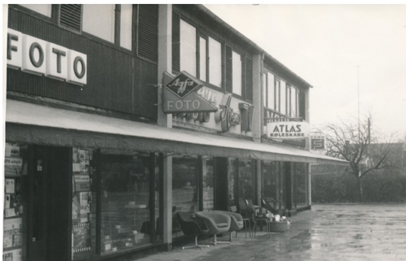
Butiksfacaden ved Lagermanns Radio og TV på Kongelundsvej 305-307. Uden for butikken står der blandt andet nogle lænestole. Fotograferet omkring 1963. Foto: Tårnby Stads- og Lokalarkiv, B6973

fjernsynet, når Lagermann kom forbi. I hvert fald i vores familie. De morer sig meget over, når de mindes, hvordan de nogle gange måtte fare rundt ved alle naboerne for at se om, de kunne bomme et par mønter, når de ikke havde flere, og der var en god udsendelse i fjernsynet.