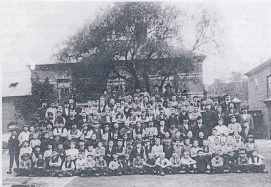
Personalet på glasværket, ca. 1910.

Alle de mange hyttespurve, børn der arbejdede på glasværket, sidder på de foreste rækker.