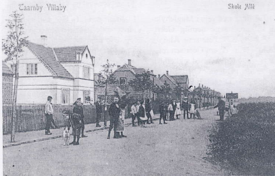
Skole Allé senere Pyrus Allé. Til højre ses grunden hvor man oprindeligt havde påtænkt en skole, i stedet kom der plejehjem. Postkort fra Tårnby Villaby, ca. 1906.

slog i 1937 at kalde to nyprojekterede veje her Argentumvej og Aulumvej = latinske udtryk for sølv og guld. Det blev afvist af sognerådet, der sendte forslagene ind til fællesudvalget med følgende forklaring: "Da disse navne må anses for mindre heldige og man i det hele taget anser det for vanskeligt at finde gode brugelige vejnavne indenfor gruppen "Kemiske Navne" har sognerådet vedtaget i distriktet øst for Kastrupvej og nord for Saltværksvej i stedet for kemiske navne at anvende navne af gruppen "træ,