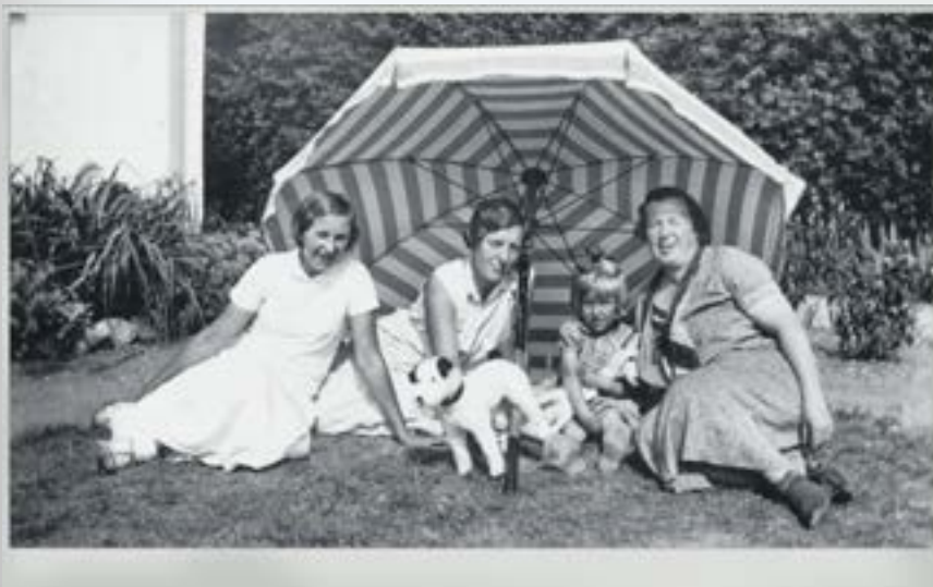
Fotoet stammer fra et album fra familien på Knarreborgvej 8 og har ingen andre oplysninger. Foto: Tårnby Stads- og Lokalarkiv, B10644