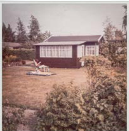
Først var kolonihaven i Tømmerupvang en feriedrøm. I 1977 blev der bygget helårshus på grunden. Foto: Tårnby Stads- og Lokalarkiv, B8300