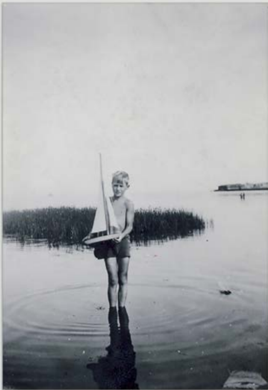
Når sommeren er uendelig lang og mulighederne for leg er mange. Fra dengang hvor strandkanten var fyldt med siv, græs og tang i det lave vand. Foto: Tårnby Stads- og Lokalarxiv, B3280