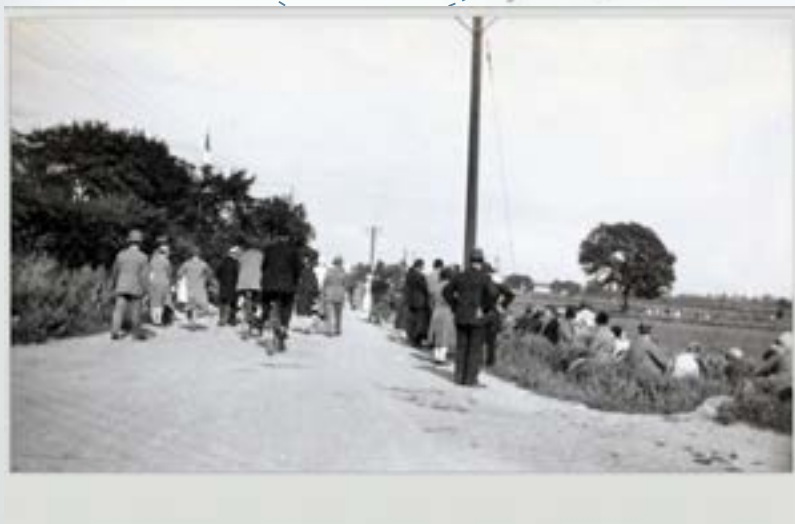
Flyvestævner blev lagt på søndage, så publikum havde tid til at tage på en udflygt for at se luftens vilde vovehalse. Her strømmer folk til på vejen Ved Diget. Fotograferet 1930.