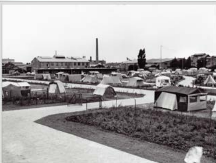
Alle arkivets fotografier af campingpladsen er fra det første år. Pladsen lukkede efter sommersæsonen i 1978.