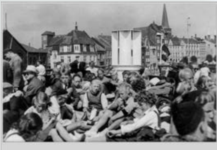
Børn på vej til feriekolonien Solhytten ved Grenå Strand – siddende på færgen i Århus Havn i 1948.

Børn fra Tårnby blev tilbudt ferie på solkolonierne. Den første blev indviet i 1938 i Grenå, fra 1950 blev Solgården i Hørve en realitet og fra 1954 Solkrogen i Gedesby. De gamle kolonier blev udskiftet med nye i 1980'erne.