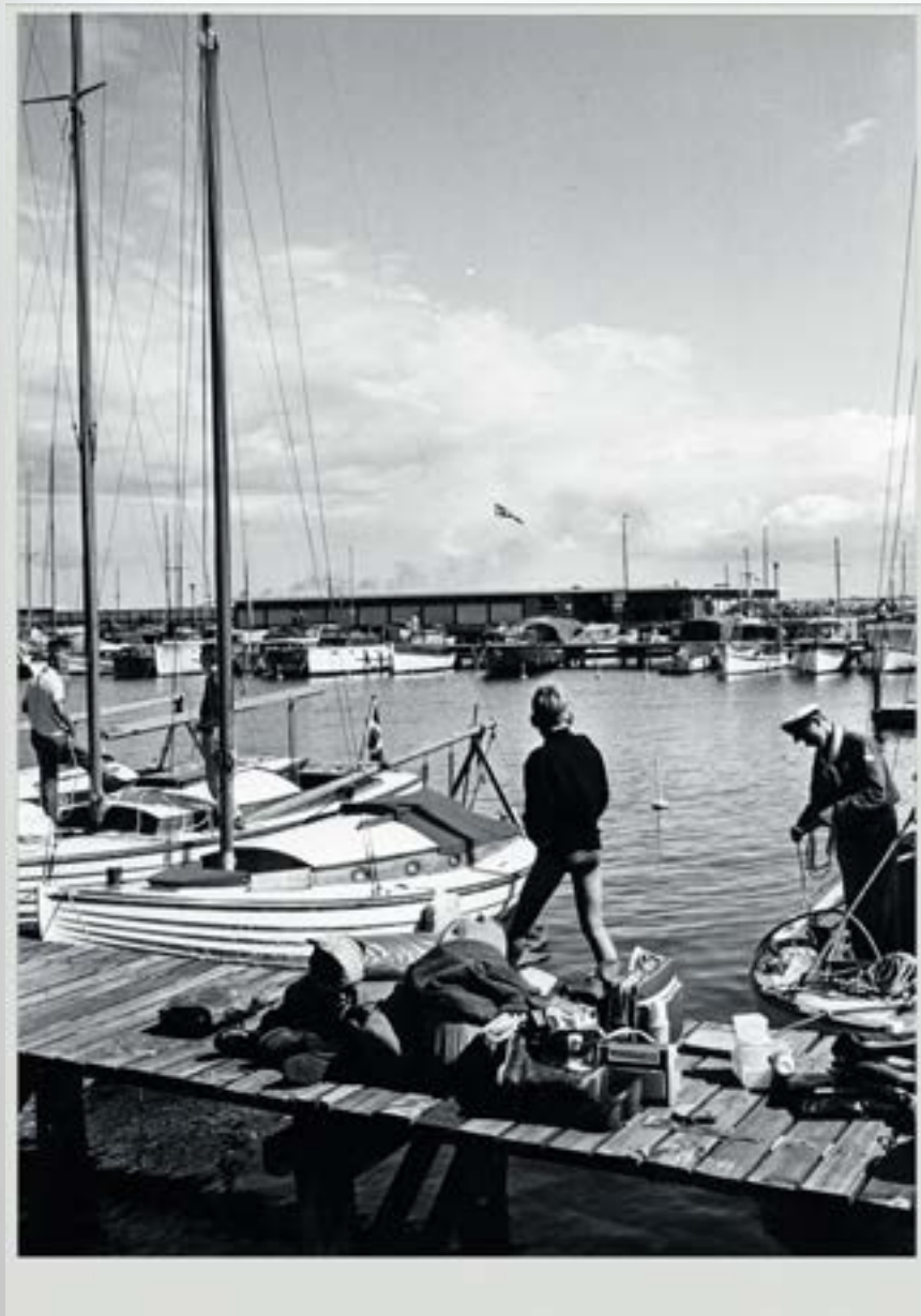
Fra den første lystbådehavn blev etableret i 1954 – nu kaldet den gamle, hvor der var plads til 155 både.