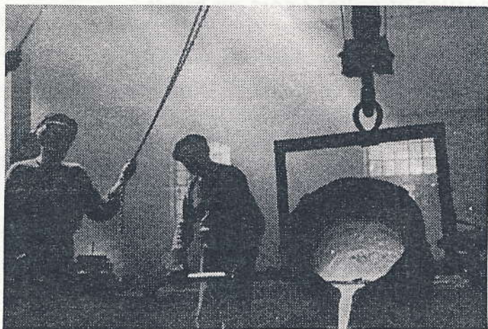
Dragør Jernstøberi omkring 1948.