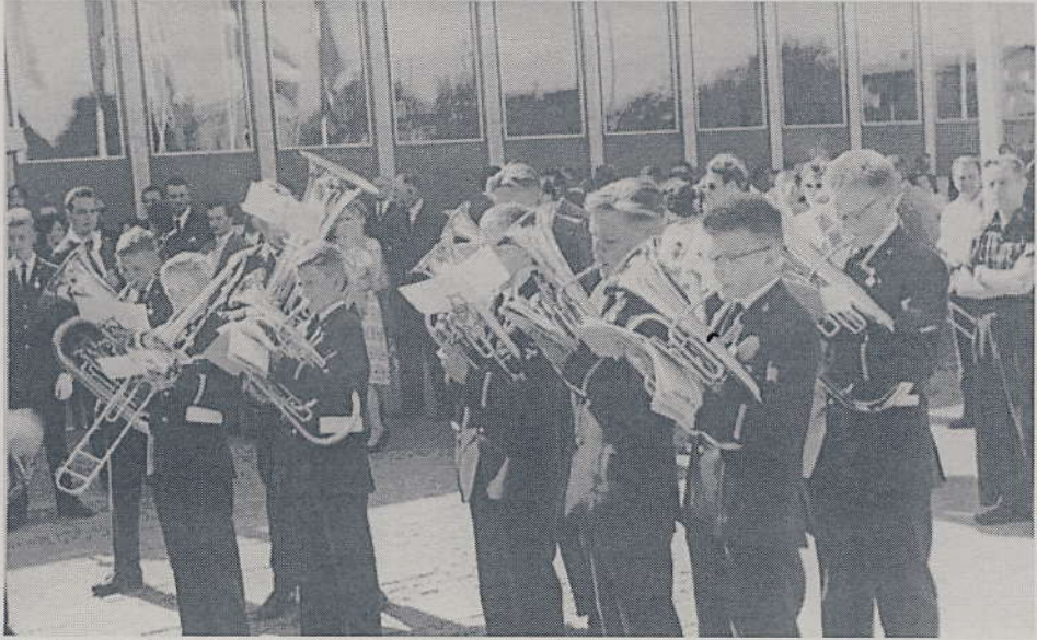
Rådhuset blev indviet den 24.6.1960 med musik og taler. Her spiller det lokale "Skotterne" for de 500 indbudte gæster.