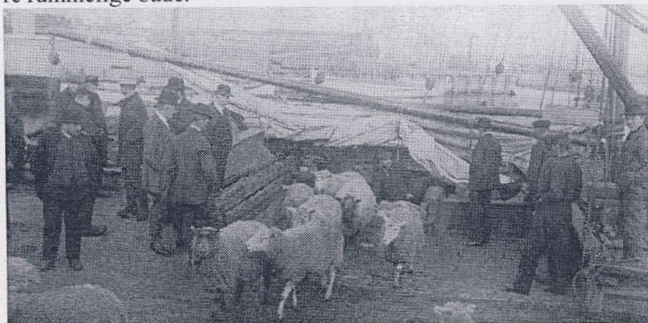
Der udskibes får fra Saltholm i Kastrup havn ca. 1920

Den ældste "færge" eller passagertransport ad vandvejen fra Kastrup er postbåden til Saltholm. Men først var der en anden "færgeforbindelse", der fragtede en anden type passagerer nemlig kreaturer til Saltholm. Det foregik med "skøjter" (herfra stammer gadenavnet Skøjtevej), en lavbundet hollandsk skibstype, som fragtede disse sommergæster over til øen. Siden kom andre og mere rummelige både.