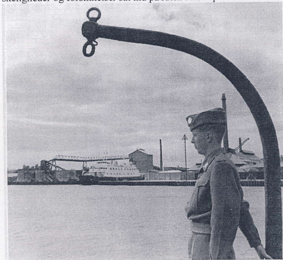
Kastrup-Malmøfærgeren i Kastrup havn ca. 1960.

120 år efter at den første egentlige færgeforbindelse mellem København og Malmø blev etableret, kom der en konkurrent i Kastrup. I august 1958 blev færgen "Hanne Kruse" efter flere vanskeligheder og forsinkelser sat ind på ruten Kastrup-Malmø.