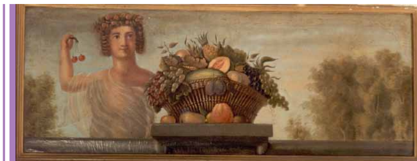
Et af de fire dørstykker fra salen på Kastrupgård. Dørstykkerne var malet af W.F. Burfeldt i 1753.

Fortling fik et omfattende landbrug ved siden af fabriksvirksomheden Kastrup Værk, i kraft af omfattende jordkøb i Kastrup, Maglebylille og Sundbyøster. Han lagde med sin fabriksvirksomhed i Kastrup grundstenen til den industrielle udvikling i Kastrup. I gavlen på portbygningen er det følgende minde skrevet i saltholmsmarmor. Her oversat fra latin: