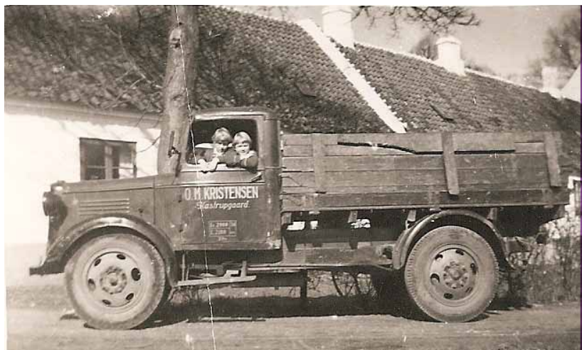
Kastrupgårds lastbil. Ca. 1953

mester var gået, kunne man jo altid grave skoddet op. Han rullede selv sine cigaretter, det bedste var, hvis der på lokummerne var glemt noget toilet-papir 00, så brugte han dette. Ellers måtte han ty til lidt avis-papir.