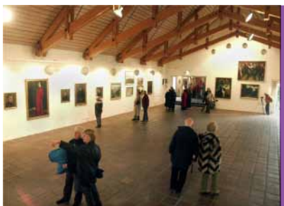
Kastrupgårdsamlingen. Foto: Dirch Jansen, 2003

Jeg er født i København i 1942, og vi boede dengang i Fredericiagade. Min biologiske far døde den 1. maj 1944, så mine erindringer om ham er meget