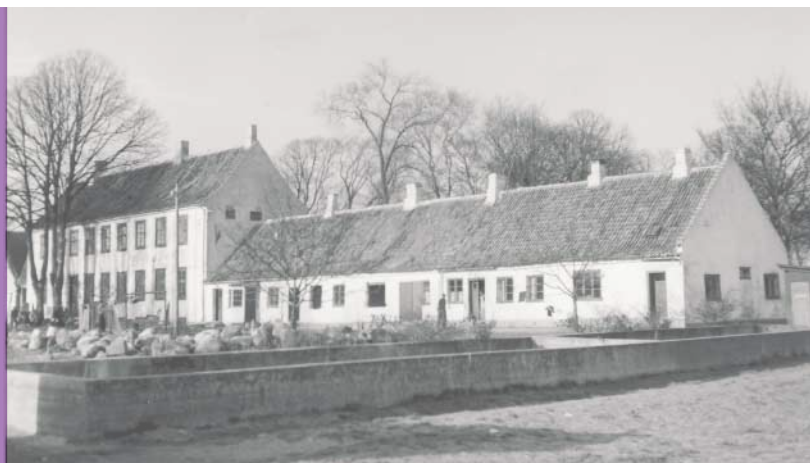
Kastrupgård med vandbassin forrest samt hovedbygning og sidelænge mod syd, hvor Ole og hans familie boede. Foto: Viggo Iversen, ca. 1957

Lejligheden bestod af køkken, stue, soveværelse, et lille kammer samt en stor havestue, der havde en dobbeltdør ud til haven beliggende bag bygningen. Sanitære installationer var der ikke meget af, en vandhane i køkkenet og ellers ikke andet. Skulle vi have bad, var det etagevask eller hvis far havde