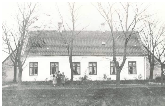
Elmegård, Amager Landevej 275. Ca. 1910.

På det vestre hjørne af Amager Landevej og Tømmerupvej lå et lille to-familiers hus, der led under landevejens stadige udvidelser med bredere kørebaner, cykelstier og fortove. Til sidst gik landevejen klos op ad huset, og det var formentlig en af årsagerne til, at huset blev revet ned i løbet af 1950'erne.