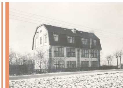
Tømmerup skole opført i 1907. Ca. 1927.