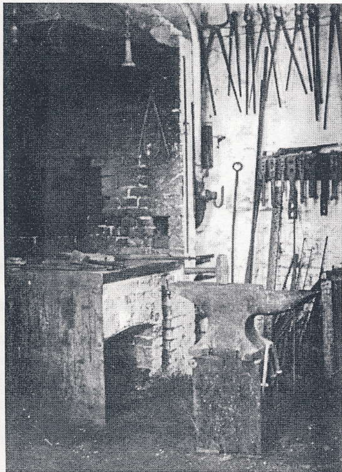
Smedien i Viberup, 1950

At se ham tilvirke en greb eller rive eller en knækket tand på en harve ud af en klump glodende jern hentet ud fra essen med en lang tang. Han formede med en hammer på en jernbolt, og indimellem blev genstanden dyppet i vand, så det sydede. Det var herligt at komme ind i