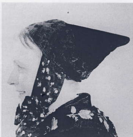
Tårnbydragten eller Danskedragtens hovedhøj.

de, hvorfra der kunne sælges hurtigere og mere. Man kørte aldrig hjem, før vognene var tomme. Om dette kan fortælles mange sjove ting, om hvordan de konkurrerede med hinanden.