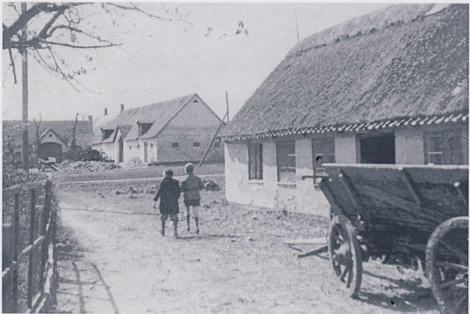
Fra Maglebylille i 1970 lige før husene måtte vige pladsen for lufthavnen.

neskelige omkostninger ved ekspropriationsforretningerne.