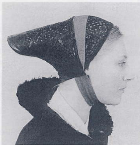
Hovedtøj fra St. Maglebydragten.