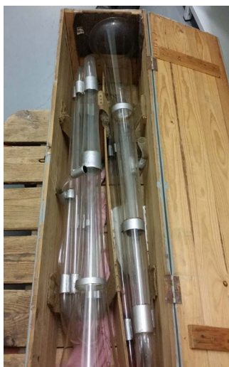
Glasinstrumenterne i deres specialfremstillede trækasse.