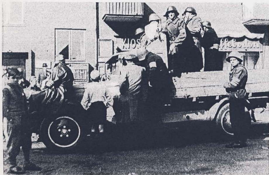
Frihedskæmpere ud for Kastrupvej 80, 5. maj 1945.

Vi fik udleveret armbind og blev indkvarteret i St. Magleby skole, hvor vores lille gruppe, der hørte til den ældre årgang, lagde beslag på 1. sal, mens de øvrige lå i et sandt roderi mellem madrasser, soveposer og geværer i pyramideform i gymnastiksalen. Morgenmad fik vi på St. Magleby kro ved hjælp af lottekorpsset - alt i alt godt arrangeret.