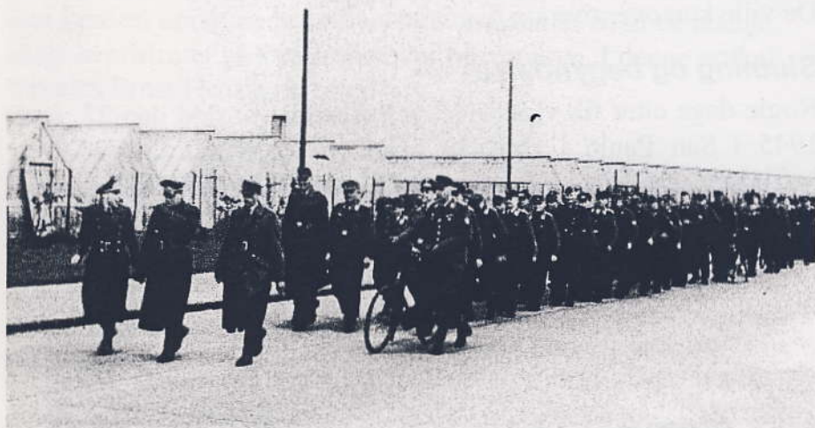
Tyske soldater forlader Danmark efter kapitulationen. Her er et kompagni på vej fra Lufthavnen ad den gamle Lufthavnsvej, maj 1945.

de - "a va' for noget." "Feltråb!" gentog de. "Vi har ikke noget feltråb," sagde vi, det må de have glemt at give os om morgenen. Nå, så blev de fornærmet og gik ned til stranden, hvor de så lå og skød ud over vandet.