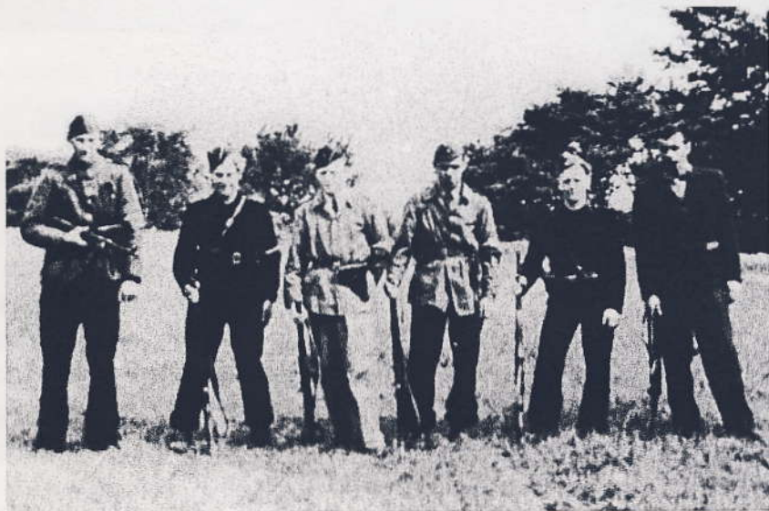
Frihedskæmpere fra AMPA-gruppen A.5. Her fotograferet på Kastrup Fortet, maj 1945.