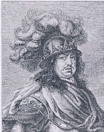
Carl 10 Gustav af Sverige

mange krige mellem Danmark-Norge og Sverige i løbet af 1600-tallet.