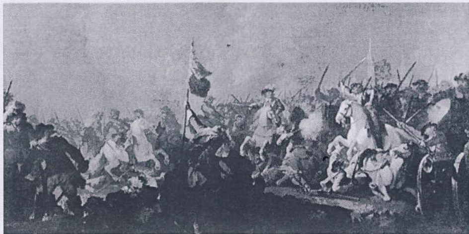
Slaget midt på Amager skildret af maleren C.A. Lorentzen i 1791. Oliemaleri, Statens Museum for Kunst.