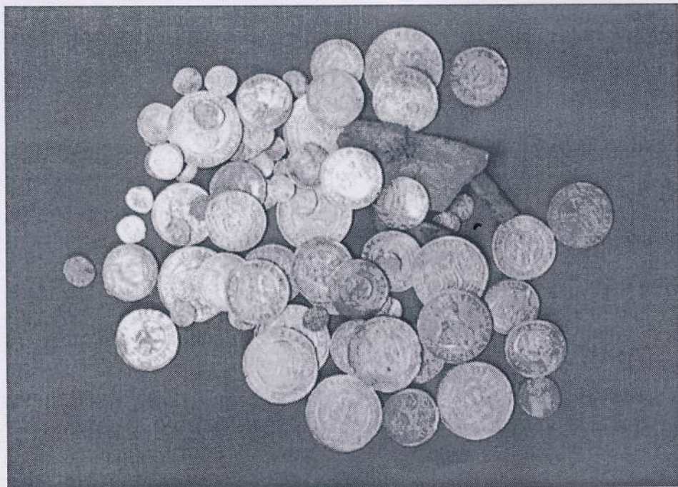
I St. Magleby blev der i 1989 fundet en skat i der ligner den fra Tømmerup. Den yngste mønt her var fra 1657. Det er mønterne fra denne skat, der er på billedet. Skatten opbevares på Amagermuseet.

1655, så den må være gravet ned under krigen. Ejeren af skatten nåede aldrig at grave den op igen, eller fortælle sin familie, hvor den var gravet ned.