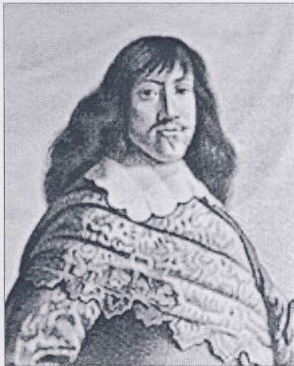
Frederik den 3 af Danmark