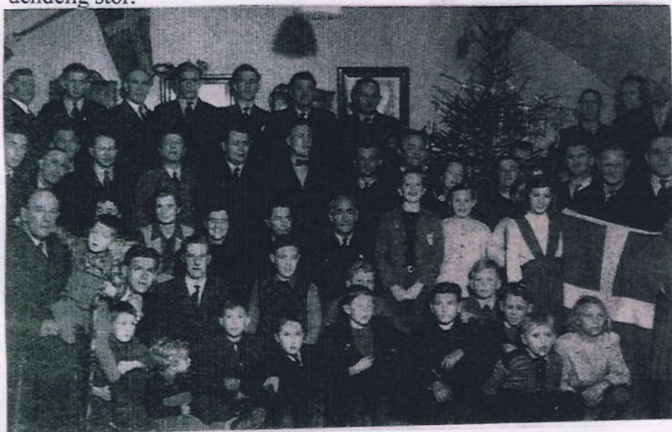
Flygtede Kastrupfiskere med deres familie fejrer jul i fiskernes hus i Limhamn 1944

Trods den senere diskussion om den økonomiske side af jødetransporterne er der ingen tvivl om, at de danske fiskere satte livet på spil –og som ovenstående beretninger lyser af: er de reddede jøders taknemmelighed selv her mange årtier senere uendelig stor.