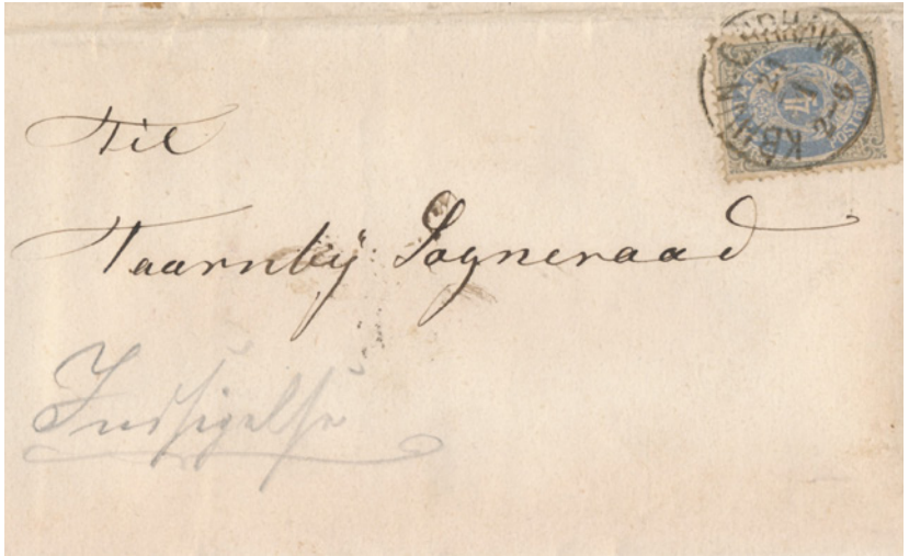
Et acceptabelt navn og en fyldestgørende adressen på modtageren i 1876: Tårnby Sogneråd.