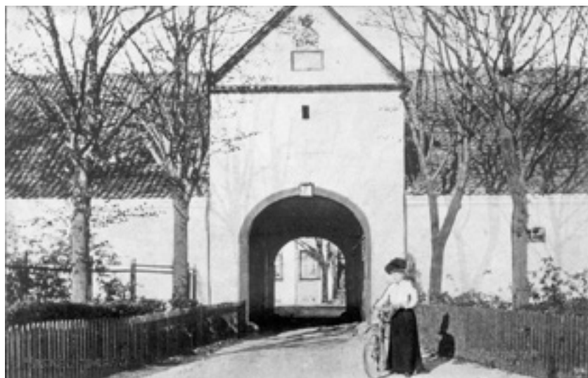
Kastrupgårds portbygning med de allerede i 1903 imponerende høje træer – en kvinde står med sin cykel.

Når man trådte ind i hovedhuset, var det trin op til en anden verden – både i fysisk og i symbolsk forstand.