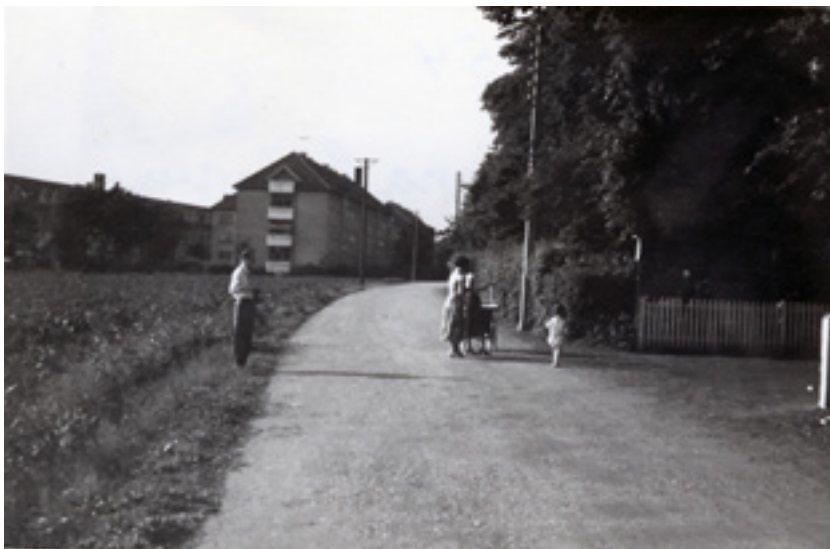
Den oprindelige Kastrupgårdsvej – familien står ud for Kastrupgårds indkørsel og portbygning, som dog ikke kan ses her. Fotograferet i 1954.

Det er i dag et stort parkområde, som rummer faste skulpturer og kunstværker samt mange træer. Området har foruden også rummet midlertidige installationer såsom et kunstlegehus, som børn og voksne byggede sammen i 1983.