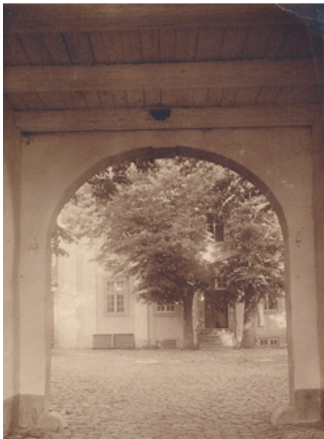
Kastrupgård set inde fra porten med den gamle brostensbelægning og de store træer ved trappen op til hovedbygningen. Motivet er fra et postkort sendt i 1914.

På Kastrupgård har trappen op til hovedhuset givet en klar retning fra porten. Der er i den nyere brostensbelægning gjort særligt ud af at markere de forskellige veje, som man kan passere gårdspladsen på.