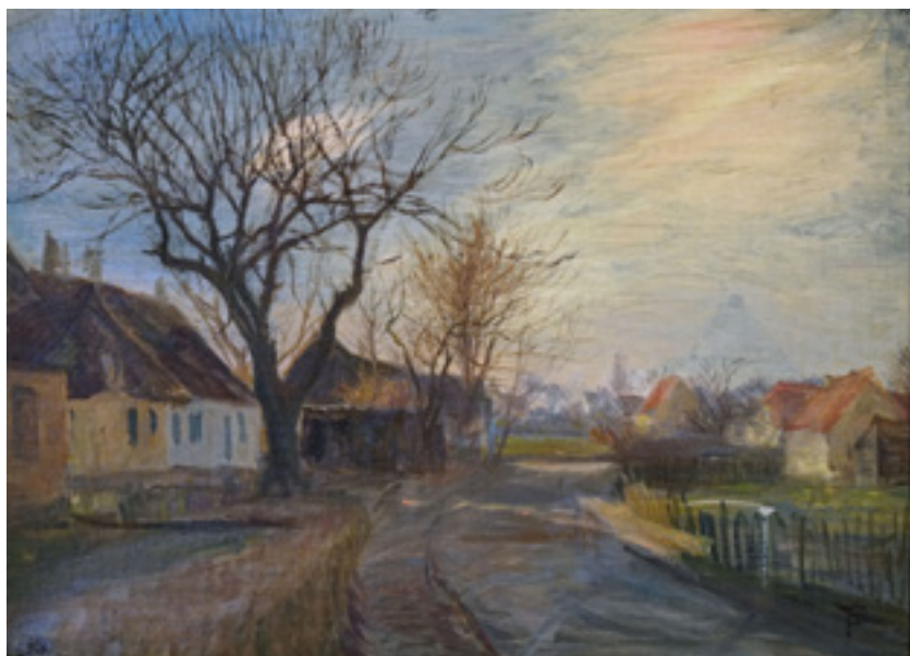
Oliemaleri af Theodor Philipsen fra 1905 af husene på vejen, der nu hedder Ved Stationen. Tårnby Kommune – deponeret på Kastrupgårdsamlingen. B8055