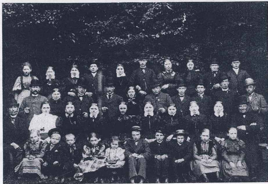
Beboere fra Maglebylille på foreningsskovtur i Kongelunden. Ca. 1895

for afhentning af tang på stranden. Formanden for bylauget var oldermænden, der indkaldte til gæstestævne for bylaugets medlemmer, det vil sige alle hartkonrsejerne i byen. I nyere tid blev bylauget bl.a benyttet ved de mange sager vedr. eksproprieringen af landsbyen.