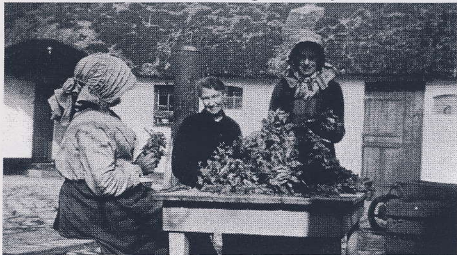
Der sorteres spinat på Søndergård. Navne efterlyses. Ca. 1930.

Man benyttede tangen ved strandkanten til kulerne om vinteren. Der var ofte kamp om tangen, så bylauget fastlagde i 1850 nogle regler om afhentningen. Tangen måtte ikke hentes før solopgang eller efter solnedgang, og ikke sammenhobes på stranden. Tangen blev først anset for bjærget, når den var kørt op på tanglægget eller lå på ejerens jord. Grøn tang måtte ikke køres i bunker men skulle fjernes med det samme. Hvis man ikke overholdt disse bestemmelser, skulle man i 1850 betale 4 rigsdaler til byens kasse.