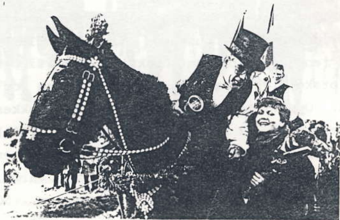
Tøndekongen modtager sit kys fra dronningen.

Kl. 16 starter tøndeslagningen og tøndekongen skal findes. Han belønnes med en stor rød/hvid sløjfe, der bindes om venstre arm og får et kys af årets tøndedronning. Ved ballet om aftenen skal han danse de første tre danse med tøndedronningen, som før i tiden var ældste uforlovede pige, men som nu udpeges blandt medlemmernes unge døtre.