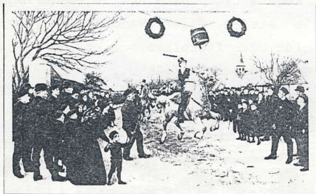
Tønderidning i St. Magleby på Amager.