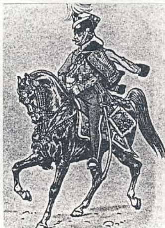
Husarkorpsets paraderidetøj. Ca.1830.

Seletøjet er kopieret fra husarkorpsets paraderidetøj. Seletøjet er besat med snogepander eller porcelænssnegle. Hvert seletøj bliver påsyet med ca. 800 sneglehuse. Den hvælvede side slibes glat, og undersiden med den takkede rille vendes frem.