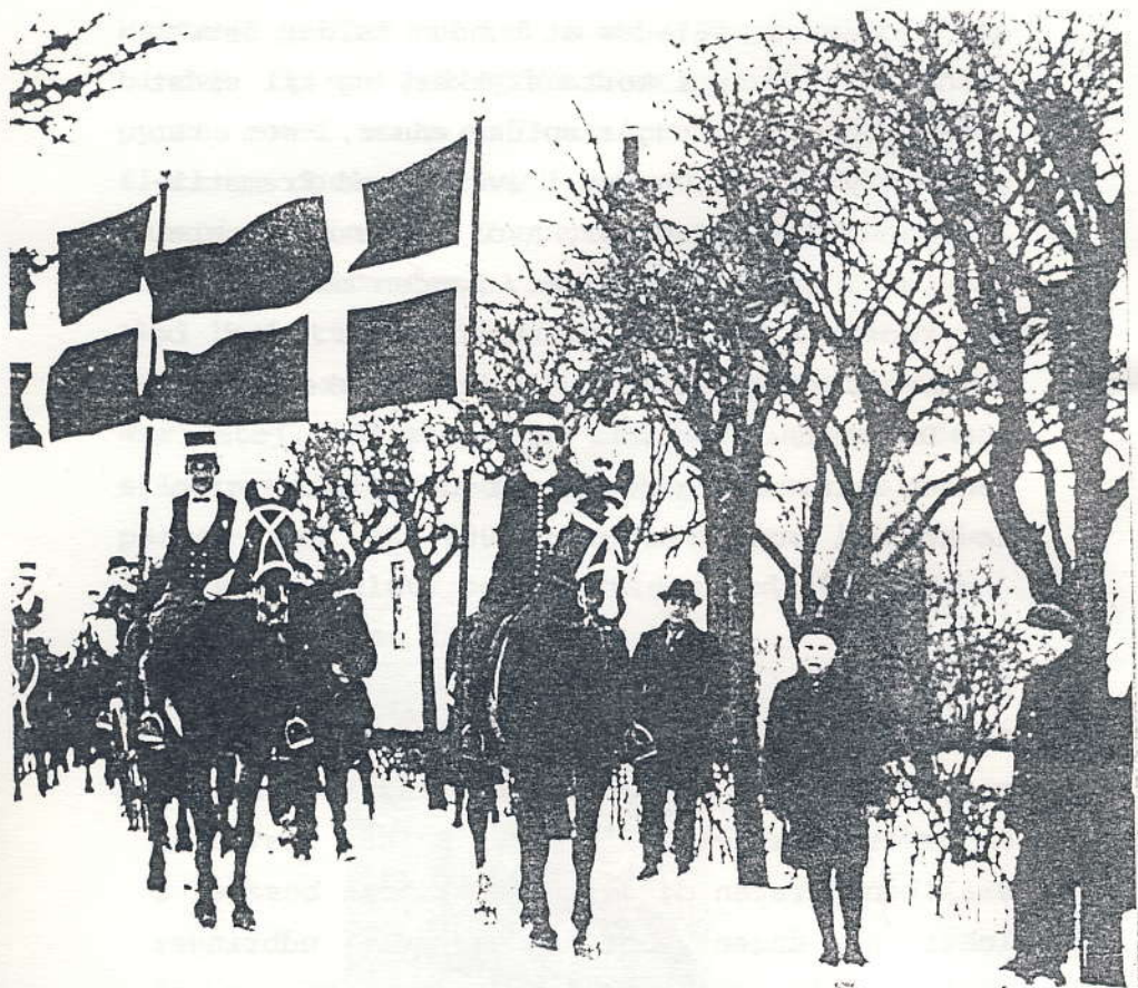
Flagmænd i Tømmerup, ca. 1935. Fra venstre: