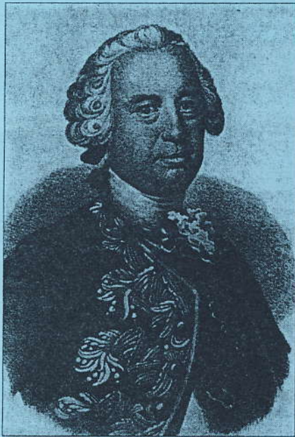
LAURIDS DE THURAH