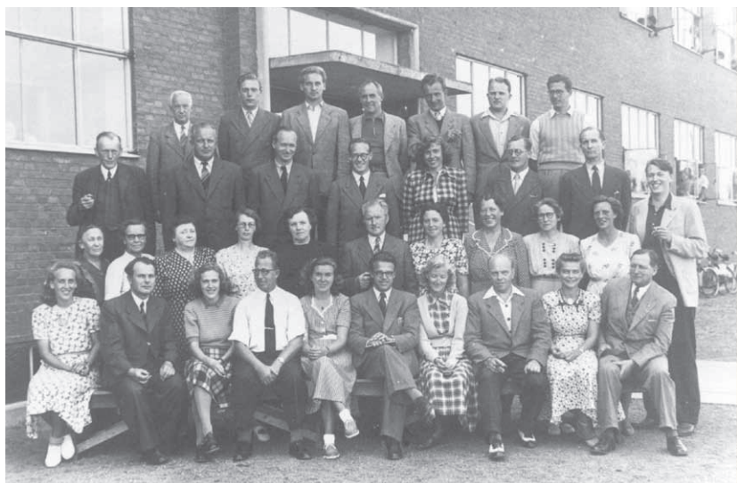
Lærere fra Korsvejens Skole ca. 1950. Foto: Stads- og Lokalarlivet, B1879

var man fri for at skulle hjem og fortælle forældrene noget. Nogle gange kunne man se aftrykket af alle hans fingre på kinden! Han brugte også en metode, hvor han lagde armen rundt om skulderen. Sådan lidt kammeratlig. Når man så var blevet afhørt, rettede han lynhurtigt armen ud i stræk, og man fik derved et slag fremad.