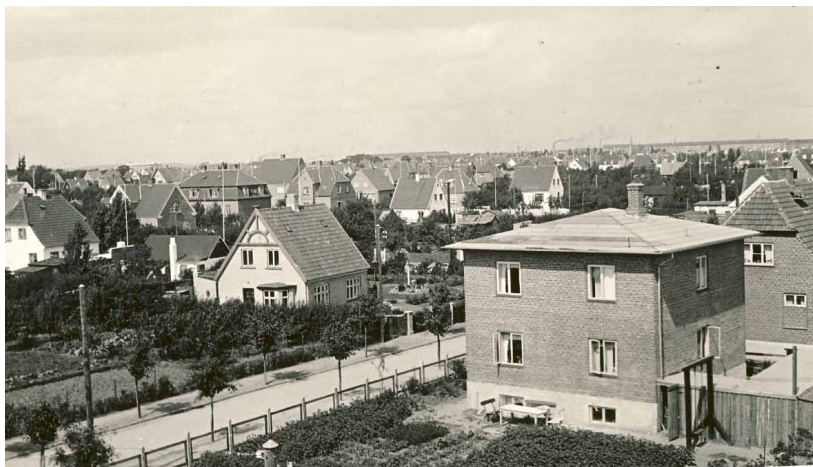
Kvarteret omkring Hyben Allé i 1932. Foto: Stads- og Lokalarkivet, B4773

Nogle af dem sendte vi af sted oppe fra førstesalen og ned i haven. Ned kom de jo altid. Det var ikke altid, at de kunne flyve bagefter. Så måtte de en tur på reparationsværkstedet.