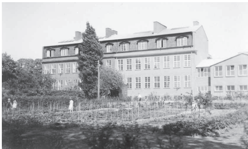
Skolehaver på Korsvejens Skole ca. 1940. Foto: Stads- og Lokalarbivket, B5276

vagten i frikvarteret. Vi samlede en del sne og formede noget skyts – snebolde.