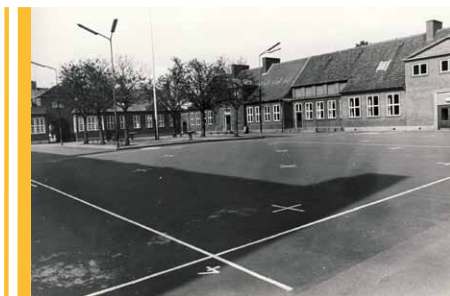
Skolegården på Korsvejens Skole som den så ud i 1950'erne.

I skolegården var der drikkevand lige i midten af gården. Så var gården malet op med en hvid streg hele vejen igennem gården og forbi drikkevandet. Det var for at adskille de små og store klasser. På min første skoledag tog min mor med op på skolen. Der var modtagelse i gården, og så gik vi over i den fløj, der vender ud mod Amager Landevej. Det var for de små klasser. Fløjen til højre var for de lidt ældre klasser. Bag ved skolen lå en række skolehaver. De var især beregnet til skolebørn, hvis forældre ingen have havde derhjemme. Så min søster og jeg måtte ikke få nogen skolehave.