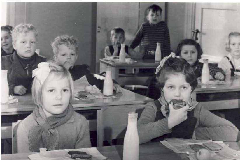
Skolebespisning fotograferet til en Socialdemokratisk valgavis fra ca. 1950.

Det var meget praktisk. Der var vi ovre til tjek, med vejning og måling af højden. Så lyttede han på vore lunger, og han hev ud i underbukserne og sagde: ”host”.