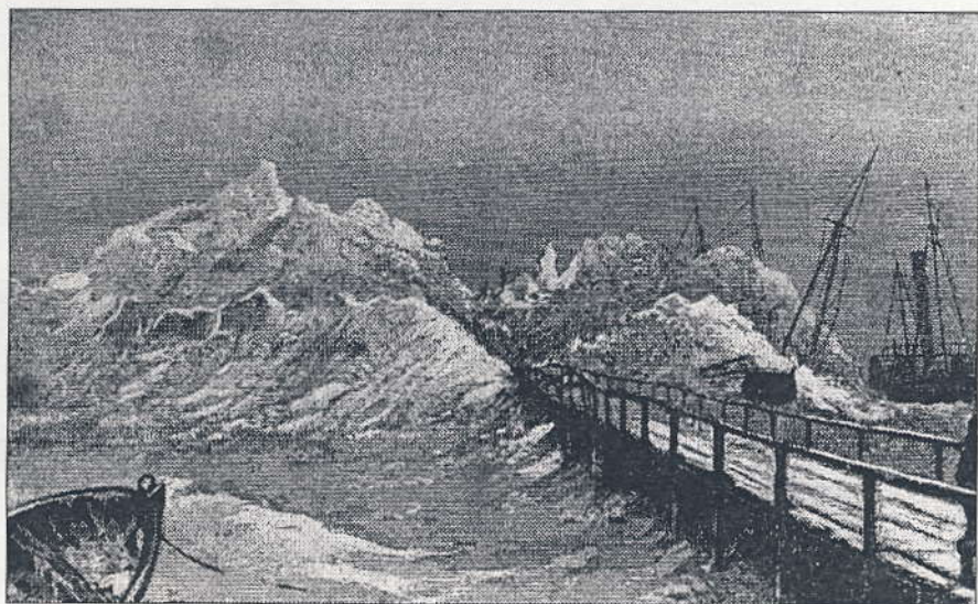
Isbjerg ved Kastrup.

"Familiens Håb", hvis bagstavn på vor tegning ses at rage frem af ismassen, og væltede bjergningsdamperen "Harriet", der dog var kommen på ret køl igen. da vor tegner tirsdag morgen ankom til stedet efter en forholdsvis farefri rejse via Kristianshavn, for at give dem af vore læsere, der ikke personlig have taget naturfænomenet i øjesyn, en forestilling om dets udseende og omfang."