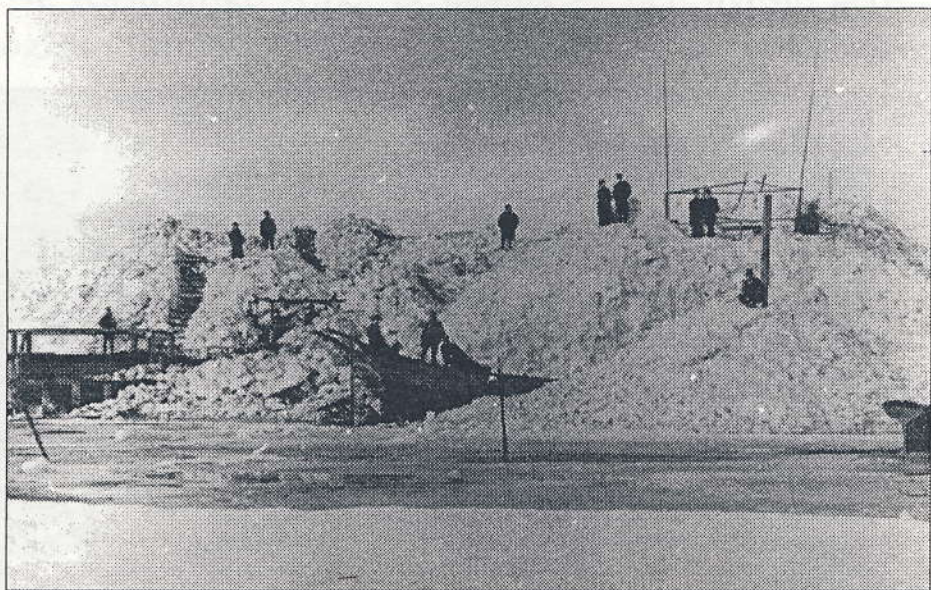
De Kastrupske Alper. 1881.