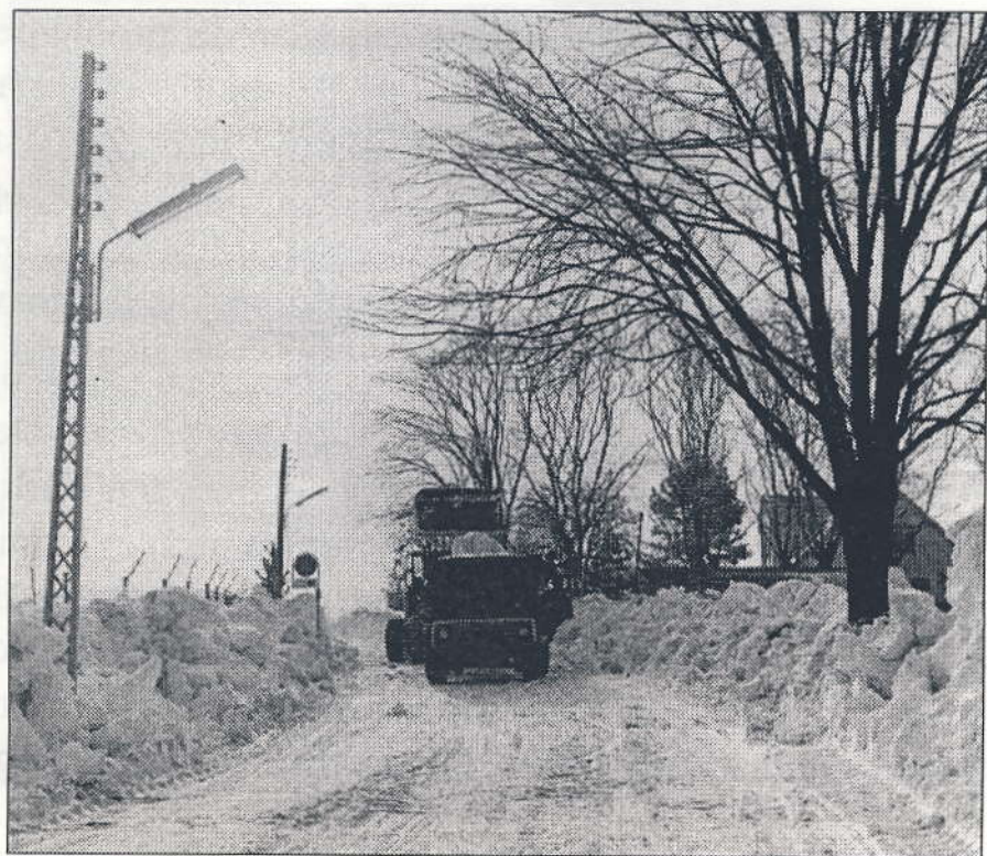
Fejemaskine på Tømmerupvej. 1979.

Den hvide vinter er over os og fejmaskiner dominerer gader og veje. Sjappet ligger tykt og gør enhver cykel- og gåtur til et mareridt, skønt det der med snerydning er blevet en ret så effektiv sag, sammenlignet med fortidens "snekrads".