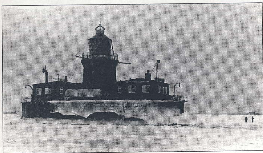
Nordre Røse fyr.

Tømmerupvej. Man kunne f. eks. stille den første tørst bag købmanden i Viberup, energisk grave sig frem til "Cafe Cykelhjulet" alias "Mellemsmeden" og ende hos købmanden i Ullerup, som man så efter bedste evne og økonomisk formåen søgte at tørlægge. Så vidt jeg har forstået, var de forskellige gårde forpligtet til at stille med mindst en mand, og hele menageriet blev koordineret af den valgte snefoged."