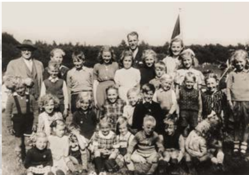
Der var knyttet søndagsskoler til mange kirker. Her er det Luthersk Missions søndagsskole i Tømmerup, der er samlet omkring 1930-1935.

I Danmark fik de reformerte lov til at udøve deres religion allerede fra 1685 – længe inden Grundloven. Det skyldes, at dronning Charlotte Amalie selv var kalvinist og hun opnåede religionsfrihed, ligesom også hendes hof og senere andre kalvinister fik det. Dronning Charlotte Amalie var gift med kong Christian 5.