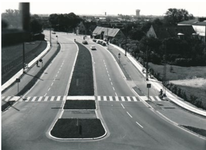
Englandsvej, hvor Tårnby Torv senere blev opført. Fotograferet 1967. Foto: Tårnby Stads- og Lokalkiv, B7412