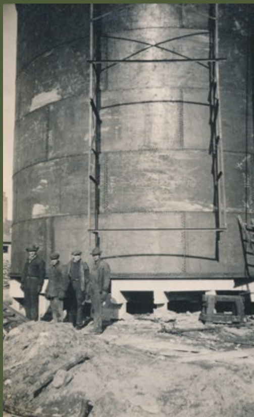
Arbejdskammeraterne fra Vølund efter den kæmpe gasbeholder blev rejst. Fotograferet i 1931.