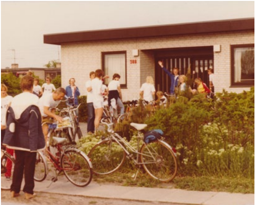
På arbejdspladsen foretog medarbejderne mange aktiviteter sammen. Her er de ansatte på cykeltur – Amager Rundt. Fotograferet i 1981 før 1. salen blev bygget til.

vi gik i seng godt trætte. Vi fik løst problemet inden for tiden til alles tilfredshed. En anden gang, jeg var sammen med Peter i Holland, var der lidt mere fritid, så vi tog til Amsterdam, shoppede og spiste god mad. Det var lige før jul, og vi så også julemanden køre i kane ned af gågaden. Jeg har også været i Sverige et par gange med Peter. Der boede vi på en gammel kro, der serverede