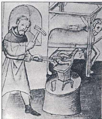
Gammel tegning af smeden i færd med at lave en hestesko.

En af smedenes skytshelgener er Sankt Elegius, som engang havde skoet Fanden og derved fået magt over ham. Hesteskoen blev et symbol for lykke.