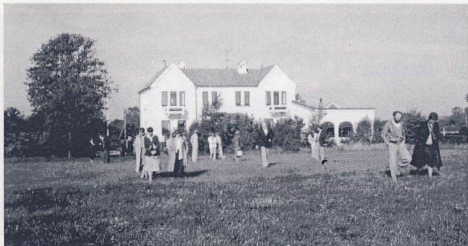
Den ny koloni beses af lærerstaben, 1980.