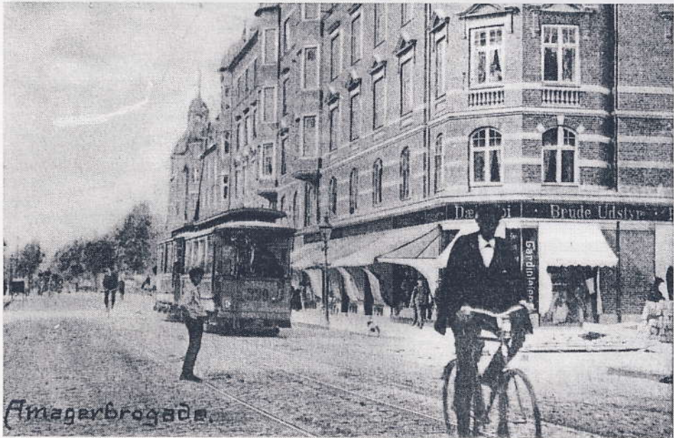
Sporvogn på Amagerbrogade ved Holmbladsgade.