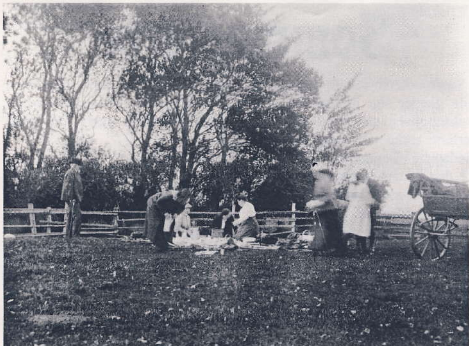
Familien Fuchs fra Kastrup er på udflugt til Saltholm i 1921.

Det kunne ske, at de voksne talte sammen og blev enige om en fælles tur til Saltholm med frokostkurven søndag formiddag, - eller til Remissen, en lille skov der hvor lufthavnen nu ligger, eller andre steder hen. Men fælles for det hele var, at man slog sig sammen, - også når man kom hjem igen, - det kunne være privat eller det kunne være i Sanghaven, - og vi børn var altid med, og vi morede os godt.