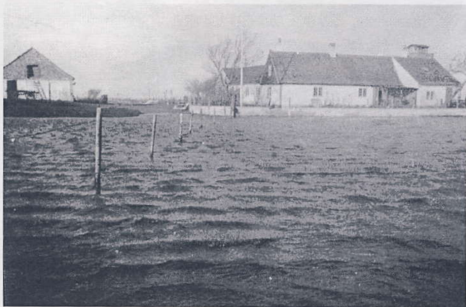
Højvande ved Bergmanns gård på Saltholm, 1941.

Vi så vandet stå forneden af det gartneri, der i dag kaldes Skan- sen. Byens mænd samledes efter- hånden, som man blev klar over katastrofen. Alvoren stod præget i disse mænds ansigter og talen gik om beboerne på Ullerup Skansevej og i Kongelunden og St. Magleby Fælle. På Raa- gaards jorder imod Kongelunden og ud over St. Magleby Fælle gik bølgerne som vi ellers ser dem i storm ved stranden. Vi fik senere at vide, at beboerne på det oversvømmede område sad på lofterne. Der blev smagt på van- det, og det viste sig at have en