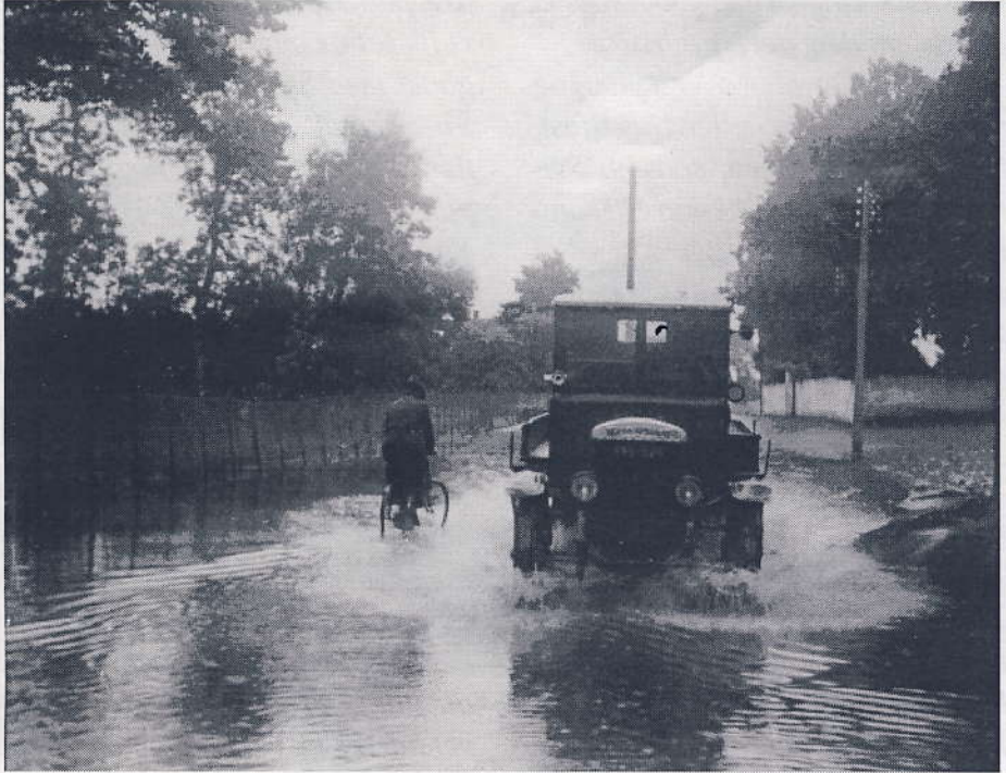
Englandsvej ud for Tårnby Kirkegård oversvømmet i august 1927.