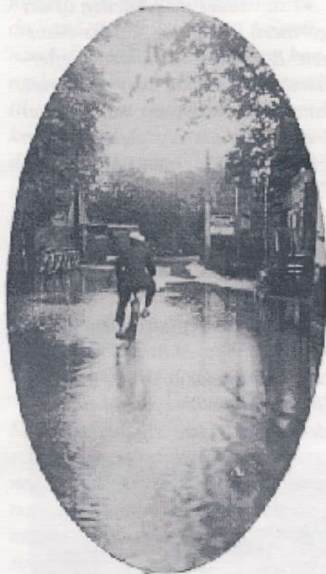
Englandsvej, ca. ved nr. 324, 1927.

meget stor saltprocent. For St. Magleby Fælleds beboere blev det en frygtelig katastrofe. Brøndene løb fulde af saltvand, varerne i kulerne blev ødelagte flere steder, der druknede mindre dyr samt harrer i Kongelunden og på jorderne, der var store økonomiske værdier, der gik tabt. Jorderne blev ødelagt for flere år. I byerne Ullerup