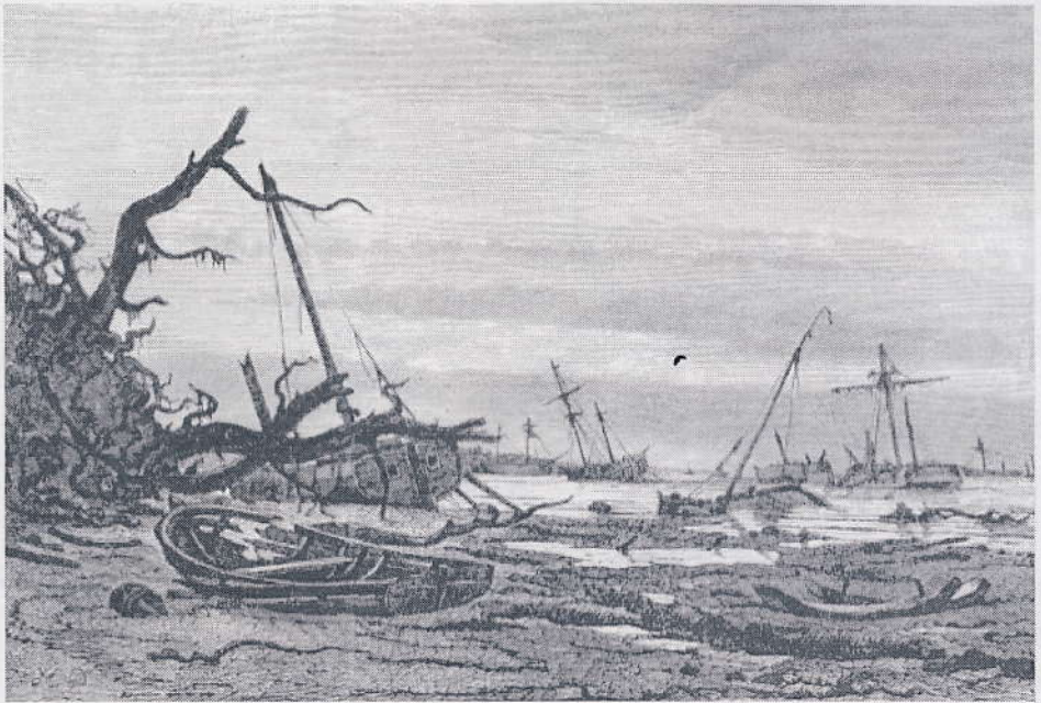
Tegning af Holger Drachmann fra Bønsvig strand, Præstøbugten efter stormfloden 1872.

land og Falster blev oversvømmet, 80 mennesker omkom og 50 skibe strandede på Sjællands østkyst. Den helt usædvanligt høje vandstand på omkring 3 meter over normalt daglig vande var resultatet af en meget langvarig og særdeles kraftig østenstorm.