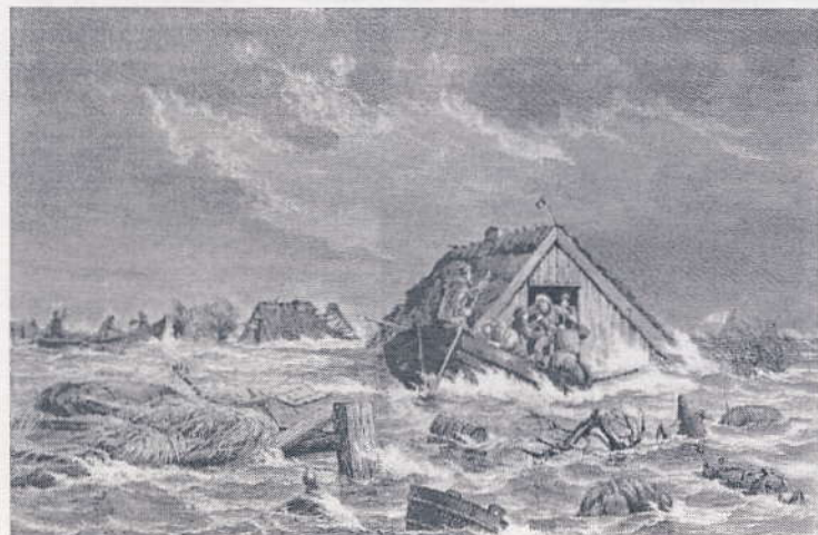
Tegning af Holger Drachmann i Illustreret Tidende fra stormfloden 1872. Her ser man, hvordan folk på Sydfalster måtte kæmpe for livet i vandmasserne.

En af de største stormflodskatastrofer i Danmark skete den 12-14 november 1872. Store dele af Lol-