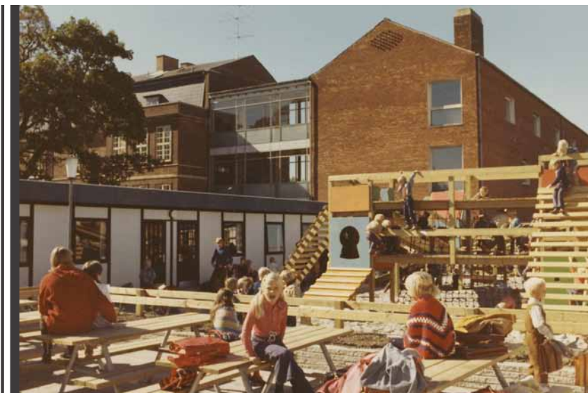
Tårnby Skoles legeplads fra ca. 1978 i et frikvarter på Sneserevej 10. Skolen blev lukket i 1986. Det ældste af skolen var fra 1907, men med adskillige udbygninger.