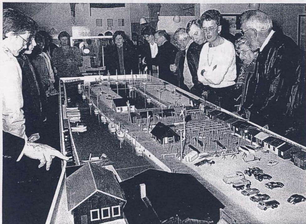
Model af broforeningens havn udført af Sven Otto Magaard i 1990. Besøg originalen- det er en oplevelse..