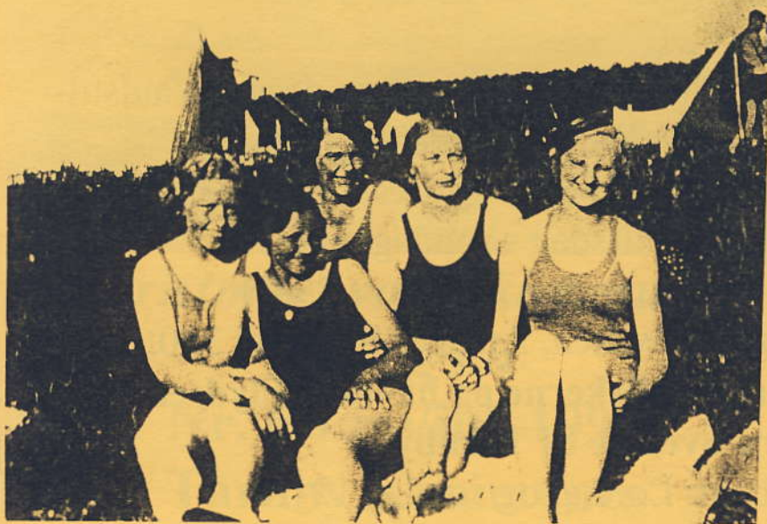
Badepiger fra Ullerup ved Sydvestpynten i 1940'erne

Lokalhistorisk Samling holder sommerferielukket fra: mandag d. 29.6- lørdag den 18.7