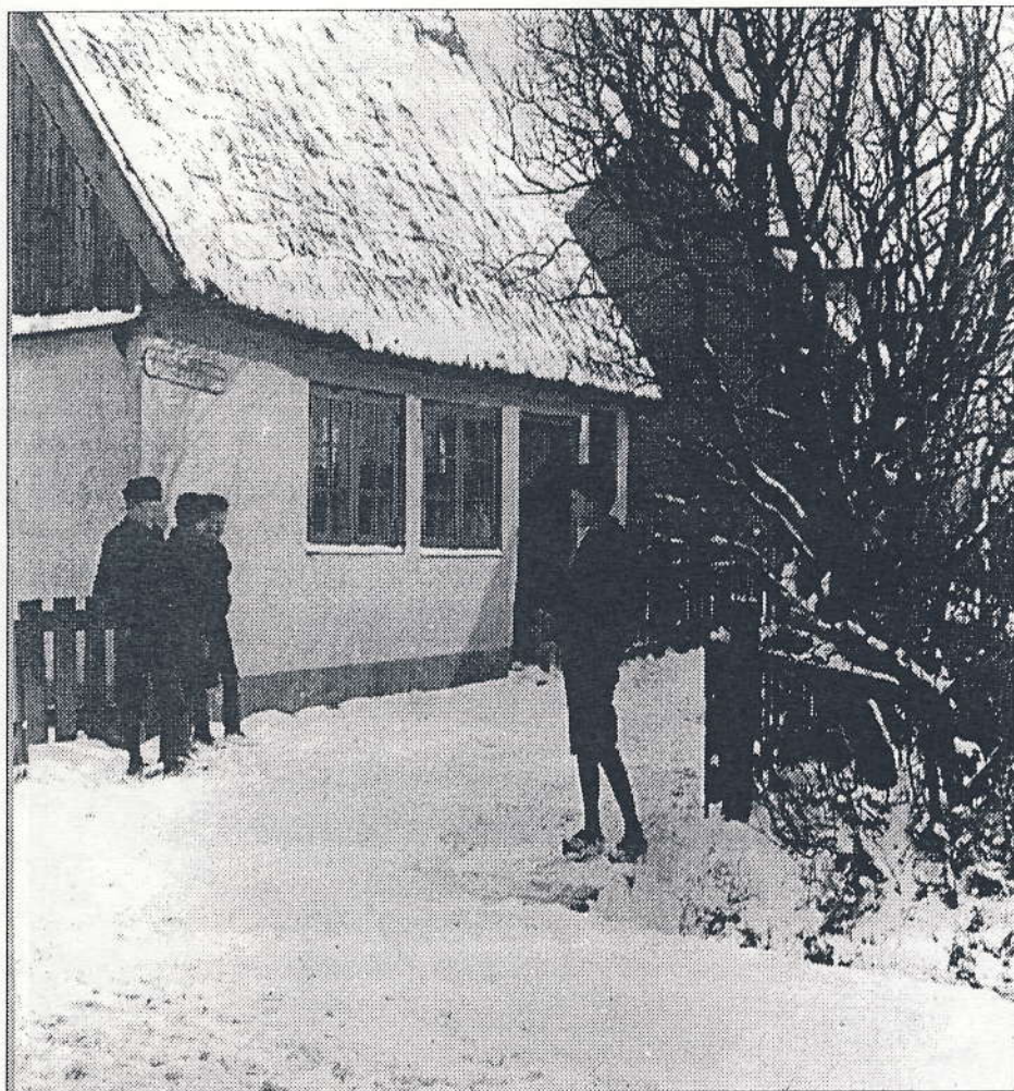
Smallestræde i Kastrup