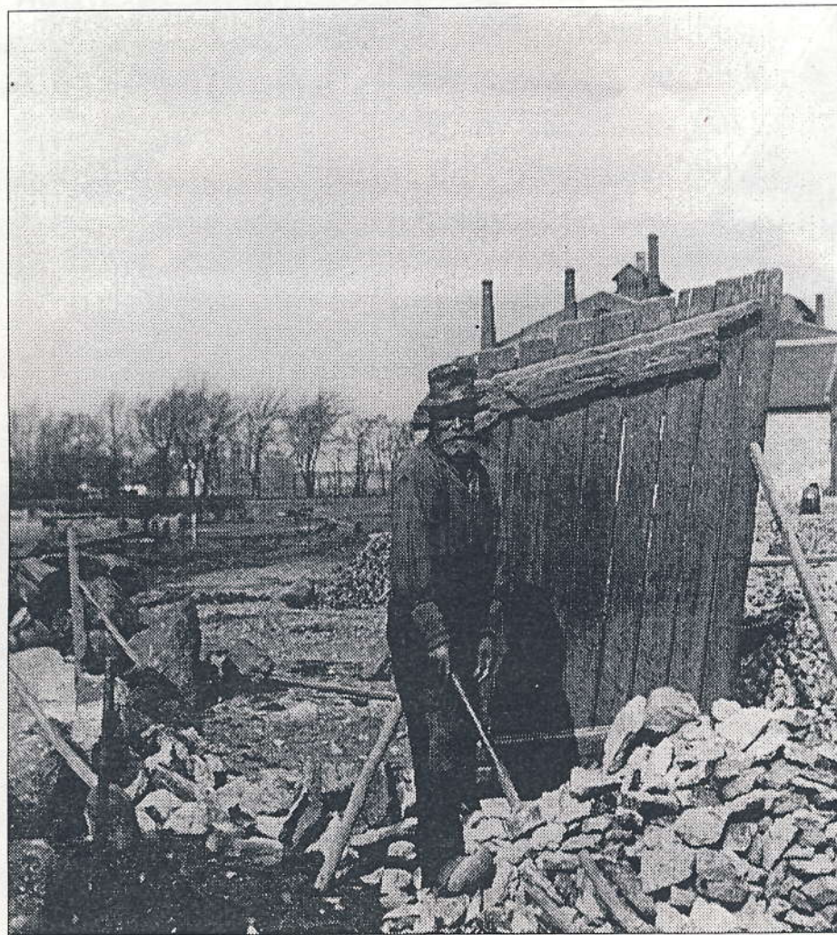
En skørvehugger i Kastrup