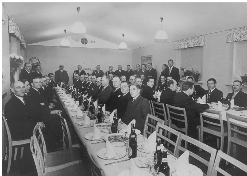
Indvielse af Arbejdsmændenes Hus på Saltværksvej 68 efter ombygningen af Carls Minde i 1949. Under loftet i den store fest- og mødesal er malet årstallene 1896 og 1949 samt et logo - formentlig for Dansk Arbejdsmænds Forbund, kaldet D.A.F. Tre år tidligere havde fagforeningen i Kastrup haft 50 år jubilæum. Foto: Tårnby Stads- og Lokalarkiv, B2669

kontoret fik adresse her, men de forblev lejere her indtil 1930, hvor de købte deres egen bygning på Saltværksvej.