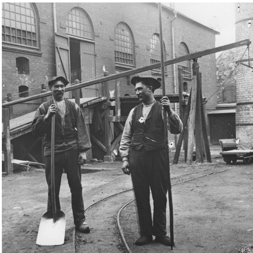
Der var en del arbejdsmænd på Kastrup Glasværk, som efterhånden også blev organiseret i Arbejdsmændenes Forbund for Kastrup & Omegn. Foto-graferet omkring 1900-1905.

Det gjorde også trykningen af hjemmelavede løbesedler, når der skulle indkaldes til møder.