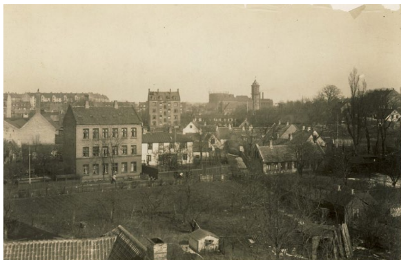
Byen i forandring – i 1910 ses stadigvæk virksomheder og fleretages huse side om side med husmandssteder og gårde. Den tidligere landsby Sundbyøster var en del af Tårnby Sogn indtil den 31. december 1895.

Arbejdsgiverne slog ofte hårdt ned på fagpolitisk og politisk aktive, inden arbejderne fik retten til at organisere sig med September-forliget i 1899. Det betød blandt andet fyring, hvis arbejderen var aktiv i socialdemokratiet eller i fagforeningen, men også sortlistning hos andre arbejdsgivere, så personen heller ikke kunne få job andre steder. Ingen turde stå som kontaktperson, og derfor havde arbejdsmandenes