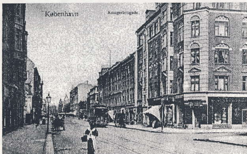
Amagerbrogade ved hjørnet af Tyrolsgade, ca. 1902.