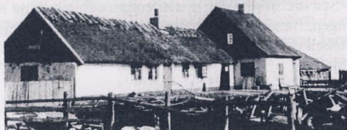
Gården Gammelværk. Saltholm, august 1943.