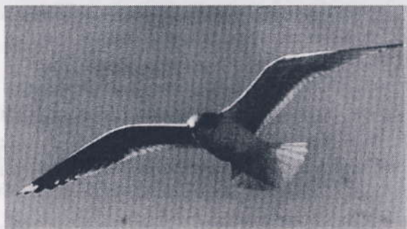
Hættemåge i vinterdragt og streng vinterkulde. Fodderne har den trukket op i den lune fjerdragt. Saltholm, vinteren 1942.

Når alle gæssene fra Saltholm er vendt hjem til deres hjemlige græsgange (på Amager), kommer så den dag, hvor "Køgemanden" kommer. Han bor, som hans "nom de guerre" (krigsnavn) antyder, nede i Køge. Han møder op hvert år for at opkøbe gæs, som han så sender - i hele jernbanevognladninger - hjem til Køgeegnen. Her bliver de så sluppet ud på stubmarkerne for at æde sig fede til Mortensaften og julen.