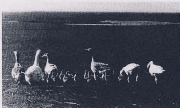
Gæs med gæslinger på Saltholm.

Det fortælles derude (på Amager), at gæssene ovre på Saltholm kan lugte, når kornet bliver høstet på agrene på Amager, og at de så ved, at stubmarkerne venter på dem. Så meget er i al fald vist, at de - når høsttiden begynder - kommer svømmende over til Amager i store flokke. Der er en mil mellem de 2 øer, og strømmen ude i Drogden er ofte så strid, at adskillige af gæssene bliver revet med af denne og omkommer på vejen over Sundet. Men for at forhindre dette, henter man gæssene hjem i store pramme samtidig med, at mejetærskerne sætter i gang på Amager.