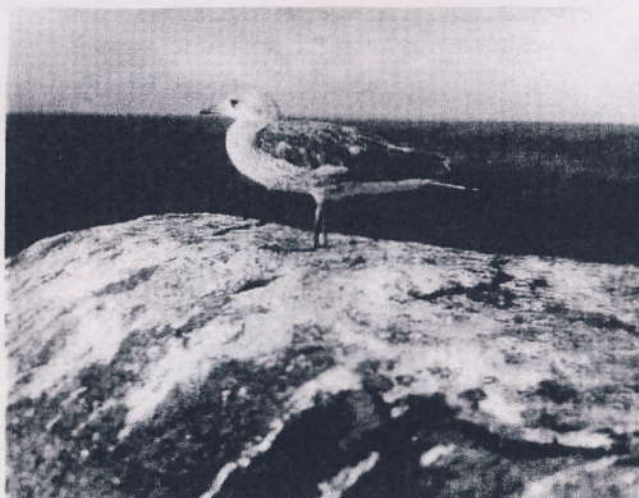
Ung stormmåge tager et hvil på saltholms største sten.

Saltholm er for de fleste mennesker øen, der er lidt svær at komme til, men som rummer mange dejlige naturoplevelser.