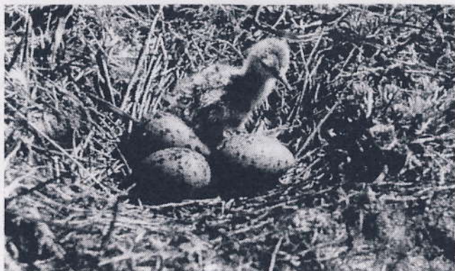
Klydeunge i rede med 3 æg. Saltholm, foråret 1943.

Der er god grund til at have en udstilling om Saltholm netop på Kastrupgårdsamlingen, for var saltholmskalken ikke blevet fundet på øen, var Kastrupgård og Kastrup Værk ikke blevet bygget.