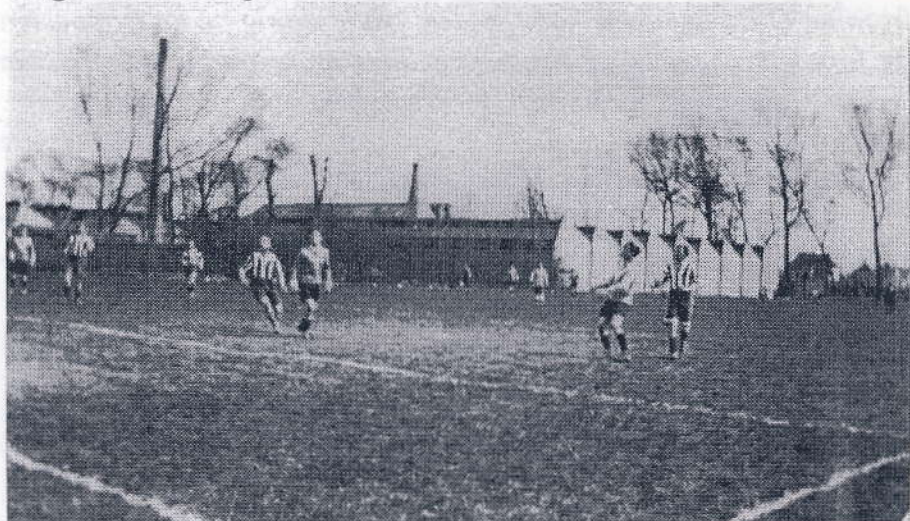
Der spilles fodbold ved Plydsen. Ca. 1923

han engang fik et par støvler, der havde været hans søsters. De var med lidt højere hæl, men den blev kappet af, så kunne han bruge dem til at sparke med.