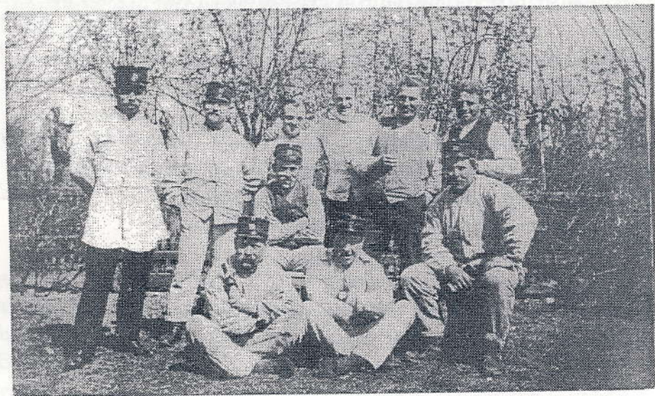
Soldater fra sikringsstyrken i Kastruplund. 1914