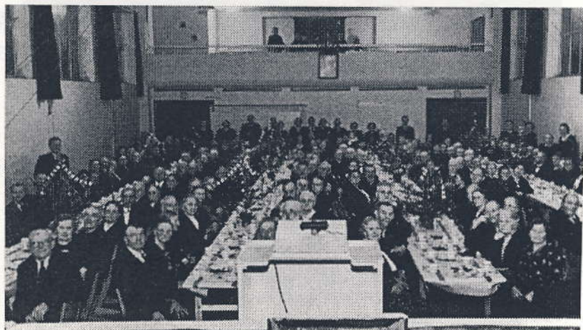
De gamles Jul 1943 på Teknisk Skole.

Traditionen rækker helt tilbage til 1924, hvor den daværende ejer af Kastruplund sammen med to af byens købmænd fik ideen om at holde en julefest for kommunens gamle. Festen blev det første år holdt på Kastruplund med 119 deltagere. Prisen for arrangementet beløb sig til 546,10 kr. Det blev en stor succes.