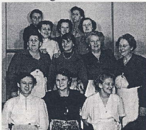
De gæve damer bag den praktiske afvikling af arrangementet. Ca. 1950.

Der er tradition for at byde på smørrebrød, øl og vand og kaffe med småkager og konfekt og en cerut. Til julefesten i 1970 kunne man i avisen læse, at der blev fortæret 5.000 stykker smørrebrød, 2.500 øl og vand, 3.600 småkager og 10.000 cerutter. Indtil 1969 fik hver deltager en julepakke med fødevarer og knas, men det blev sværere og sværere at få økonomien til også at strække til en sådan pakke. Gennemførelsen af fuld folkepension til alle overflødiggjorde vel også julepakken, mente udvalget. Under krigen var det svært at skaffe fødevarer, så korrespondancemappen og ansøgningerne til ekstrabevillinger til sukker, kaffe, gryn og flæsk blev en anelig bunke i Landbrugsministeriets baconudvalg.