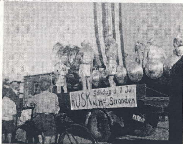
Et optog, som reklamerer for De gamles Dag. 1950.