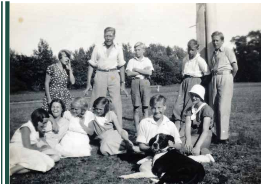
Sjakket af venner i anlægget Kastrup Fremme. Parken blev brugt til små udflugter. Fotograferet omkring 1932-1933.