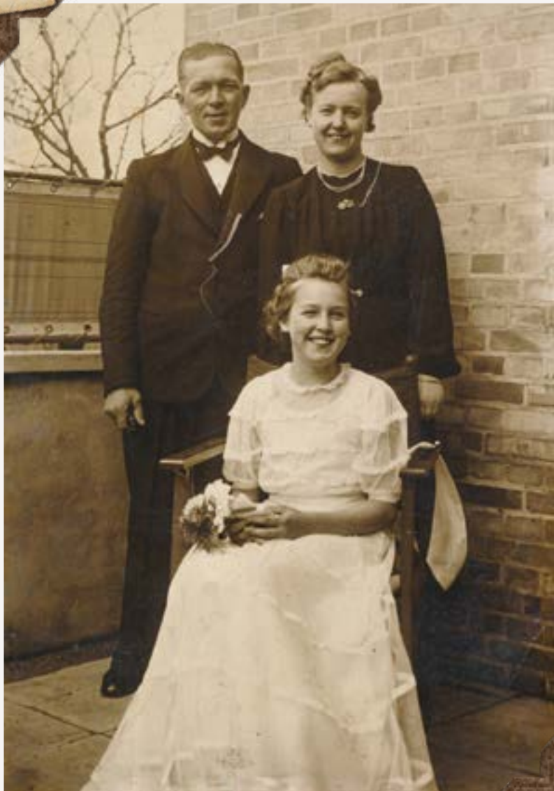
Familien som den tog sig ud i 1941, da Birthe får taget det typiske konfirmationsfoto mellem sin mor og far, men taget foran deres hus på terrassen på Søhøj Allé 19. I familien kaldes vejen blot for højen. Foto: Tårnby Stads- og Lokalarliv, B10139 - beskåret