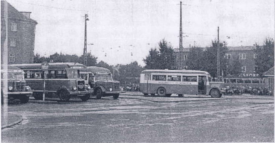
Sundbyvester Plads med Amagerbanens busser ca. 1953

I marts 1950 var jeg 18 år og gik i 3.G. Jeg behøvede en indtægt for at finansiere mine studieplaner. Jeg havde ingen idé om, hvorledes det kunne ske. Vi boede på Amager på hjørnet af Irlandsvej og Sundbyvestervej tæt ved Sundbyvester Plads. Hertil ankom busser med passagerer og personale fra Københavns Sporveje fra Rådhuspladsen. De skulle videre mod enten Kastrup, Lufthavnen, Dragør eller Tårnby. På Pladsen blev de overtaget af personale fra Amagerbanen. Passagererne blev siddende, men måtte have nye rejsehjemler. Desuden udgik Amagerbanens busser fra samme sted til Kongelunden, til Dragør Nord. og Sydstrand og nogle år senere via Finderupvej til Nøragersminde.