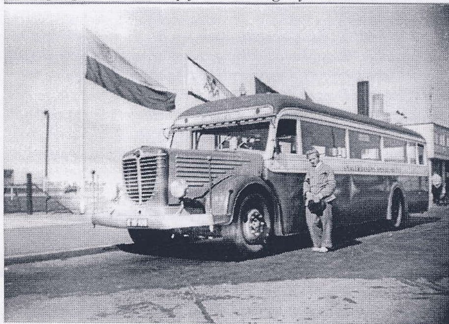
Amagerbanens busbilletør ved lufthavnen i 1949

Der var ingen, der var interesseret i at cykle længere end nødvendigt. Det var derfor godt, at der fandtes en uofficiel forståelse om, at Banens folk kunne køre med avisbilen om morgenen til Dragør via Lufthavnen. Man skulle vente på Sundbyvester Plads nøjagtig dér, hvor avisbilen gjorde holdt kl. 04.30 i 10-15 sekunder, mens chaufføren læssede sine aviser af. Så kunne man få lov til at ligge på ladet i fri luft uden noget særligt fjedersystem mellem sig og brostenene. Det var ubehageligt, men man slap for de to lange cykelture.