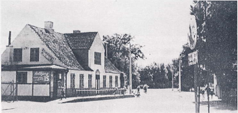
Tårnby kro ca. 1950. Det var dog ikke denne kro, der omtales i teksten, men en anden der lå på modsatte side af Englandsvej. Kroen her var indrettet i det gamle fattighus.

Ved forordning af 12.3.1735 om helligholdelse af søn- og helligdage havde alle pligt til at gå i kirke på søn- og helligdage, samtidig var det forbudt at feste på disse dage.