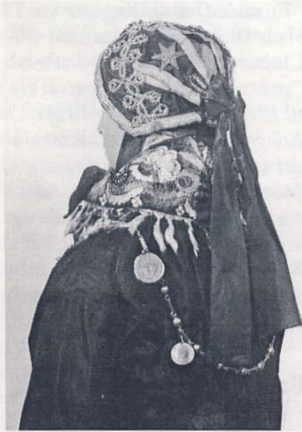
Brudesølvet fra Tårnby kirke. Hvor gammel den er vides ikke men på kæden er en mønt, der var præget til erin- dring om Chr. VII og Dronning Caroline Mathildes sidste falkejagt på Amager i 1772. Den blev sidste gang benyttet ved et bryl- lup i 1969.

Bestemmelserne blev indskærpet i 1748, men her tillod man dog igen fester på hverdage. Kravet om tvungen kirkegang blev fastholdt indtil en ny forordning trådte i kraft 26.3.1845, og reglerne angående helligdage blev lempet.