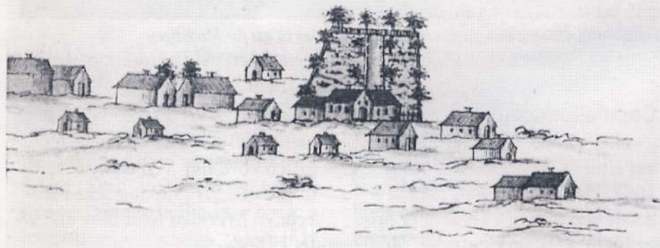
Udsnit over Kastrup landsby med Kastrupgård fra 1787.