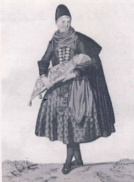
Stik af Rieter ca. 1899: En Kone bærende i stæden for Jordmoderen et Barn til Daaben i Taarnby paa Øen Amager

Med lejermål forstås samliv udenfor ægteskabet, der jo kan give sig udslag i et barn. For denne "utugt" skulle der betales bøder, og synderne skulle afgive åbenbare skriftemål i menighedens på-