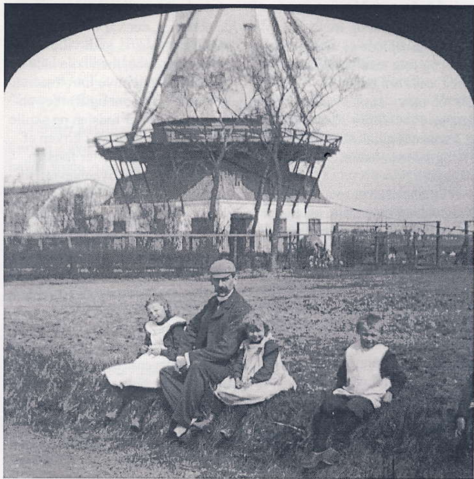
Maglebylille Mølle, den gamle mølle, der omtales lå øst for landsbyen. Foto Carl Flensburg ca. 1900.