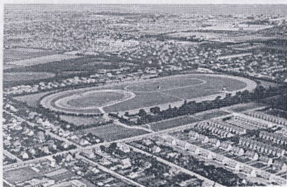
Amager Travbane ca 1950

Amager Travbane var iøvrigt den første travbane i Danmark der indførte målfotografering. Det skete i 1940.