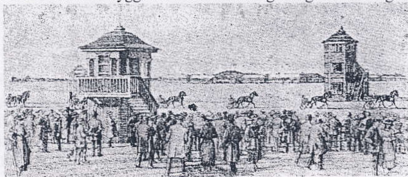
Amager Travbane 1924

I 1924 blev der bygget et dommertårn og anlagt en træningsbane