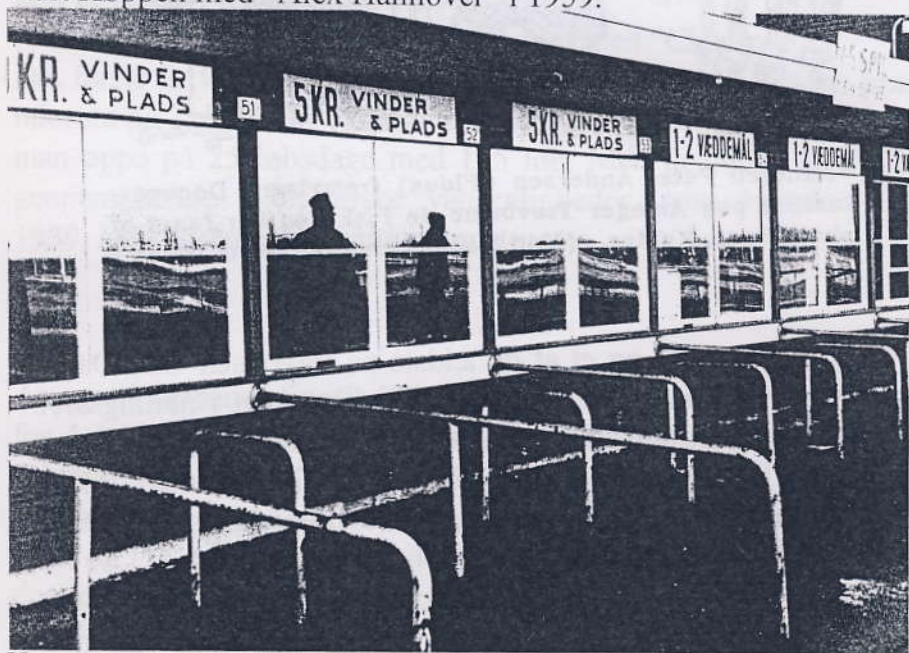
Her satsede man på sin favorithest. Amager Travbane ca 1950