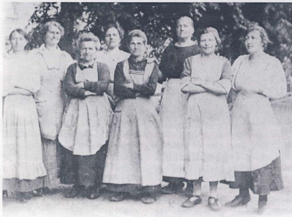
Hustruerne til medarbejdere på Kastrup Glasværk, de såkaldte "gulvkruppemadammer", der havde kaffeklub i deres hjem i Glasmagerrækkerne på Alderdomsvej 1920.