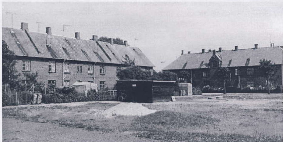
Glasmagerboligerne, ca. 1965.

I 1870 var der et stort behov for ekstra boliger, hvis arbejderne skulle bo i glasværksbyen. Men