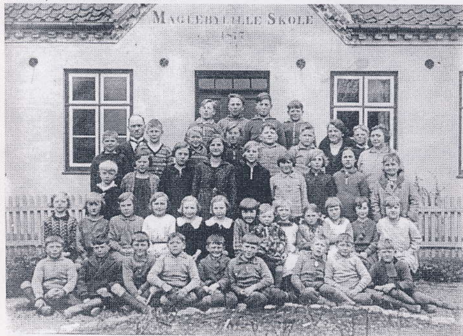
Maglebylille skole 1930

I 1930 flyttede vi til Kastrup og kom til at bo i Bagergården( en del af glasmagerrækkerne). Så jeg måtte i Kastrup Skole. Det var en stor forandring, der var jo en masse børn. Jeg startede i 4. klasse, vi var 31 i klassen.