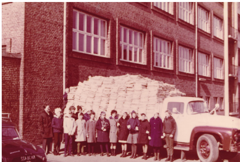
Korsvejens Skoles Pigeekor samler aviser ind. Lastbil er fuldt pakket i 1964. Foto: Tårnby Stads- og Lokalarliv, B8397