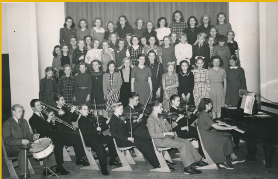
Korsvejens Skoles Pigekor og Orkester på Teknisk Skole. Fotograferet i 1948.