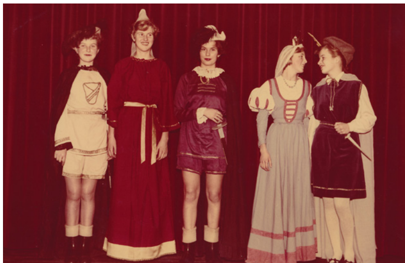
Korsvejens Skoles Pigekor optrådte blandt andet med Kunigunde.

Den 21. oktober tages med tog fra Københavns Hovedbanegård mod Tønder. Pigekoret overnatter så på Tønder Vandrehjem, hvorefter turen går til Vyck på Før. Her bliver koret privat indkvarteret.