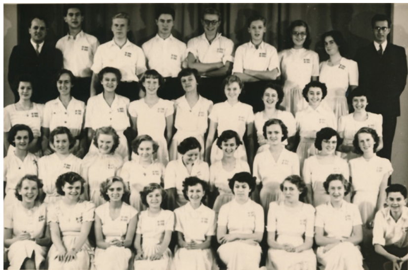
Et af de ældste fotos af Korsvejens Kor og Orkester fotograferet i 1949-1950.