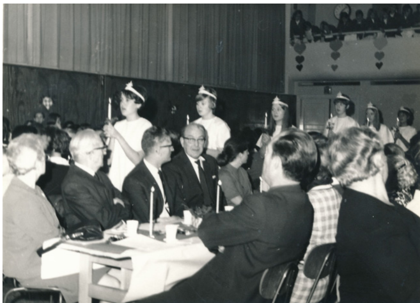
Det var en fast tradition for Korsvejens Skoles Pigechor at synge Lucia. Fotograferet i 1968 på Korsvejens Skole.

Vi gik blandt andet Luciaoptog på plejehjem, spillede krybbe-spil i kirken til jul, holdt forårs-koncerter, sang de nye elever