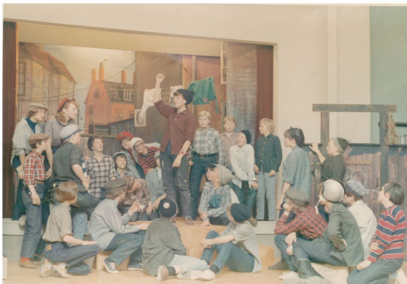
I stykket Henry var pigerne klædt ud som drenge. Lilian var Henry. Der var en del sceneskift og mange kulisser. Det gjaldt om at være på den rigtige plads på scenen på det rigtige tidspunkt. Fotograferet i 1965. Foto: Tårnby Stads- og Lokalkarkiv, B8409

Den 2. oktober 1965 optrådte Korsvejens Skoles Pigekor igen i tv. Programmet hed Firklang og var en musikquiz. Optagelsen foregik på Korsvejens Skole i festsalen,