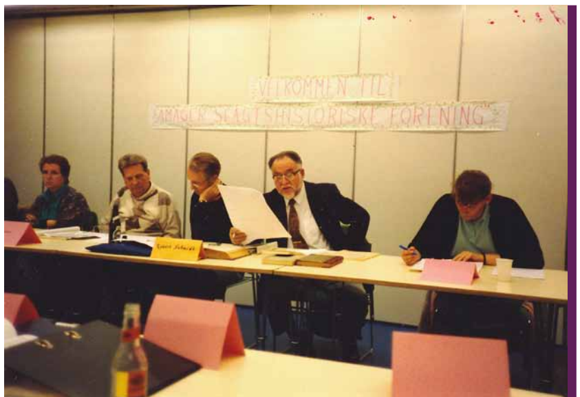
Amager Slægtshistoriske Forening til et medlemsmøde på Tårnby Hovedbibliotek i 1993.