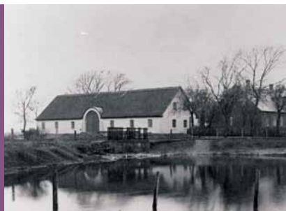
Birkegården i Tømmerup ved gadekæret fotograferet ca. 1943 på Høgsbrovej, der tidligere hed Tømmerup Kirkevej.