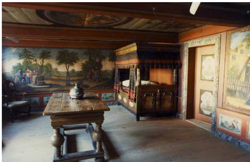
Tømmerupstuen stammer fra Birkegården på Høgsbrovej. Nu er det flotte interiør opstillet på Amagermuseet. Fotograf: Dirch Jansen, 1987

nes ankomst til Store Magleby gennem Cornelis-slægten.