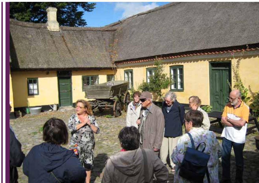
Udflugt til Amagermuseet i 2012. På Amagermuseet kan man blandt andet se storstuen fra Birkegården. Stuen bliver her kaldt for Tømmerup-stuen.

arbejdskraft i foreningen, som den fortjente og havde brug for. Det var altid givende - ikke blot i forhold til slægtsforskningsinteressen, men især fordi der i foreningen bestod en helt unik medlemskultur - en omsorgskultur - et fællesskab uden lige. Til hvert et møde tog medlemmerne imod programmerne med tilfredshed, og personligt blev jeg mødt med en venlighed og taknemmelighed, som gjorde arbejdet det hele værd.